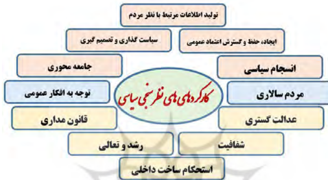
شکل شماره ۳. کارکردهای نظام نظرسنجی سیاسی در جمهوری اسلامی ایران

نظام نظرسنجی سیاسی دارای کارکردهایی برای دولت و جامعه است که به حکمرانی مطلوب کمک شایانی خواهد کرد. در مدل زیر به بخشی از کارکردهای نظام نظرسنجی سیاسی اشاره شده است.