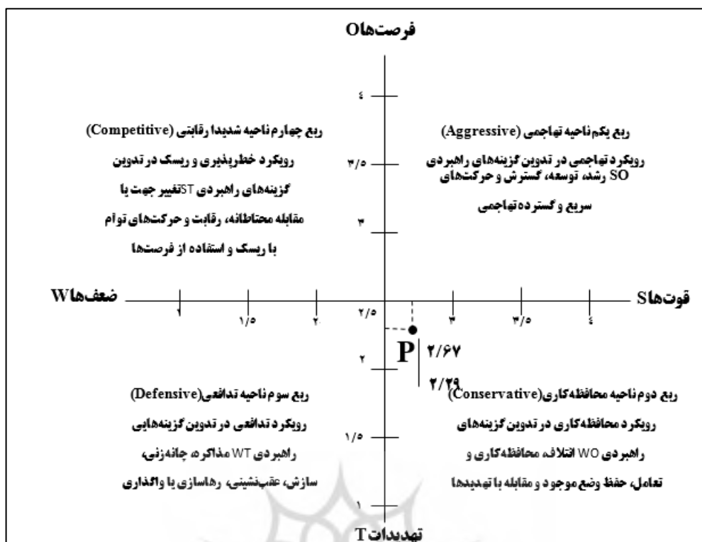
شکل شماره ۱: نمودار تعیین موقعیت و رویکرد اقدامات راهبردی