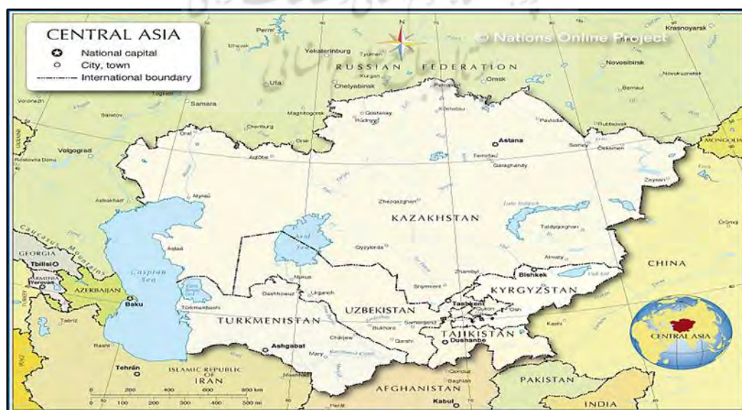
نقشه ۱: موقعیت منطقه آسیای میانه

پس از ابداع واژه آسیای میانه توسط روس‌ها در ۱۳۰۳ / ۱۹۲۴ گاه این واژه مترادف با عبارت آسیای مرکزی به کار می‌رود، در حالی که این دو از معنای یکسانی برخوردار نیستند. درباره‌ی آسیای مرکزی تعریف‌های مختلفی ارائه شده است.