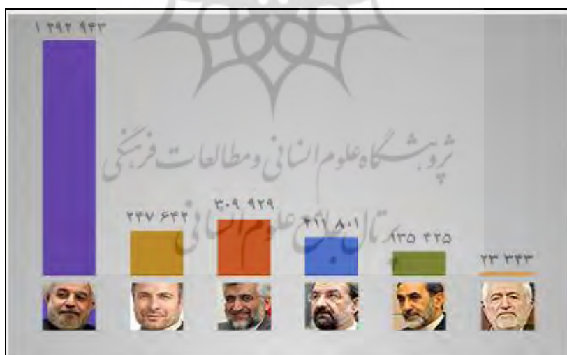
نمودار شماره ۲- نمودار نتیجه انتخابات یازدهم ریاست جمهوری در استان فارس

علیرغم اینکه ۱۰ شهرستان استان فارس مشارکت بالای ۹۰ درصد در انتخابات ۱۳۹۲ ریاست جمهوری داشتند میزان مشارکت کلی استان فارس در این دوره از انتخابات ۳۶/۷۳ درصد بود که نشانگر حضور گسترده مردم در انتخابات ریاست جمهوری بوده است. بیشترین میزان مشارکت در دوره‌های مختلف ریاست جمهوری، مربوط به سال ۱۳۸۸ است که به عدد ۸۵ درصد واجدان شرایط رسید. بر اساس میزان مشارکت مردم در انتخابات ریاست جمهوری، دوره یازدهم رتبه چهارم را به خود اختصاص می‌دهد. از نظر درصد پیروزی منتخب انتخابات، آقای حسن روحانی با هفتاد و یک صدم درصد رأی بیش از حد نصاب لازم، کمترین درصد را در تاریخ جمهوری اسلامی ایران به خود اختصاص داده است. از نظر میزان محبوبیت منتخب انتخابات میان کل واجدان شرایط رأی دادن، آقای حسن روحانی با اخذ اعتماد ۳۶.۸۷ درصد واجدان شرایط، آخرین رتبه‌های محبوب‌ترین رؤسای جمهور را به خود اختصاص می‌دهد. بیشترین میزان محبوبیت متعلق به آقای سید علی خامنه‌ای (۱۳۶۰) با ۷۰.۱۱ درصد و سپس آقایان محمد علی رجایی (۱۳۶۰) با ۵۶.۲۹ درصد، سید محمد خاتمی (۱۳۷۶) با ۵۵.۲۲ درصد و محمود احمدی نژاد (۱۳۸۸) با ۵۳.۲۳ درصد اعتماد کل واجدان شرایط رأی دادن است. کمترین میزان اعتماد نیز به آقای اکبر هاشمی رفسنجانی (۱۳۷۲) با ۳۱.۸۷ درصد باز می‌گردد. با توجه به سنت کاهش میزان محبوبیت رؤسای جمهور ایران در دوره دوم انتخابات (به استثنای آقای محمود احمدی نژاد)، به نظر می‌رسد انتخابات سال ۱۳۹۶، انتخابات دشواری برای آقای حسن روحانی برای حفظ برتری هفتاد و یک صدمی خود میان رأی دهندگان باشد. بر اساس شمارش آرا در این استان روحانی با یک میلیون و ۲۹۲ هزار و ۹۴۳ رأی و ۵۸ درصد آرا بیشترین رأی را از آن خود کرد.