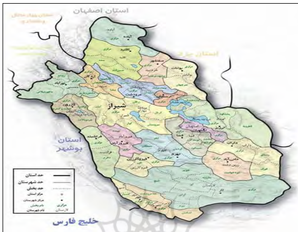
نقشه شماره ۱: جغرافیای سیاسی استان فارس (www.anobanini.ir)

این استان با مساحتی در حدود ۱۲۲۶۰۸ کیلومتر مربع، چهارمین استان بزرگ و با جمعیتی معادل ۴،۵۲۸،۵۱۳ نفر، بر طبق برآورد جمعیتی سال ۱۳۸۹ خورشیدی سازمان ملی آمار ایران، چهارمین استان پرجمعیت ایران به شمار می رود. بر اساس تقسیمات کشوری اردیبهشت ماه سال ۱۳۹۰ خورشیدی، استان فارس به ۲۹ شهرستان، ۱۰۰ شهر، ۸۳ بخش و ۲۰۴ دهستان تقسیم شده است (Website Ministry of the Interior (2016), the list of counties, (towns, cities and municipalities Iran).