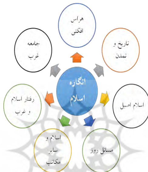
شکل ۲. محورهای موضوعی مورد تأکید مقام معظم رهبری

تروریسم، تعامل با غرب، تاریخ و تمدن روشن اسلامی، تاریخ سیاه غرب، شناخت اسلام، انگاره اسلام در رسانه، اسلام‌هراسی، آینده روشن، مضامین و معارف، جریان تکفیر و فرهنگ اسلامی و غربی حاصل شد. در مرحله بعد در نگاهی کل‌گرایانه هفت محور موضوعی که مورد تأکید ایشان بود، شکل مقابل بدست آمد.