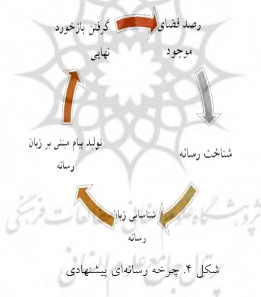
شکل ۴. چرخه رسانه‌ای پیشنهادی

خاص تغییرپذیر است. توجه به جامعه غربی برای مدیریت پنداشت جوانان غربی، طرح ریزی یک هویت مطلوب از خود در نگاه دیگران و ایجاد تأثیر مطلوب از اسلام در ذهن دیگران از یافته‌هایی است که مرتبط با مبانی مدیریت تصویر و مدیریت تأثیر است. این پژوهش برای تکمیل نتایج خود نیازمند انجام پژوهش‌های جزئی‌تر در خصوص شناسایی فرد و فرد در جامعه و فرد در رسانه در جامعه غربی نماید. همچنین مکمل این مرحله طراحی میکروسکوپیکی رهیافت‌های محتوایی برای حرکت به سوی شمولیت است. سیاست‌های محتوایی مطرح شده در کنار سایر پیشنهادها باعث تحول گسترده در این شبکه خواهد شد تا به وضعیت مطلوب مدنظر کارشناسان دست یابد. در نهایت نیاز به تأسیس شبکه‌ای تخصصی برای بحث‌های عمیق و تفسیری در مورد موضوعات مورد مناقشه احساس می‌شود. این شبکه برای حضور قوی در جهان رسانه نیازمند شناسایی دقیق این چرخه است: