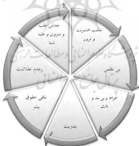
شکل ۳. محورهای اصلی انگاره‌سازی از اسلام

در حوزه پرداخت انگاره و پیام: کارشناسان چالش‌هایی را مدنظر داشتند. از جمله این موارد بود که پیام با اولویت‌های مخاطب همخوانی ندارد و یا تکنیک‌ها و تاکتیک‌های مورد استفاده اغلب جنبه تدافعی دارد. همچنین موضوعات و مفاهیم برنامه‌های شبکه غالباً واکنشی در برابر شبهات دیگر رسانه‌هاست و جنبه بداعت ندارد. مخاطب پژوهی نامناسب و نبود شناخت جامعی از مخاطب، نیازها، انتظارات و اولویت‌های وی و نیز فقدان وجود فرآیندی جامع و به‌روز برای اثرسنجی نتایج و رصد و ارزیابی فضای رسانه‌ای نیز از اهم چالش‌ها مطرح شده بود. هفت محور اصلی بازنمایی اسلام: کارشناسان در جهت ارزیابی انگاره ذهنی جوانان غربی تحت سیطره رسانه‌های غربی موارد زیر را مطرح کردند. این محورها به‌عنوان محورهای اصلی بازنمایی اسلام در رسانه‌های خبر، نمایشی و سینمای هالیوود و ... مطرح شده است.