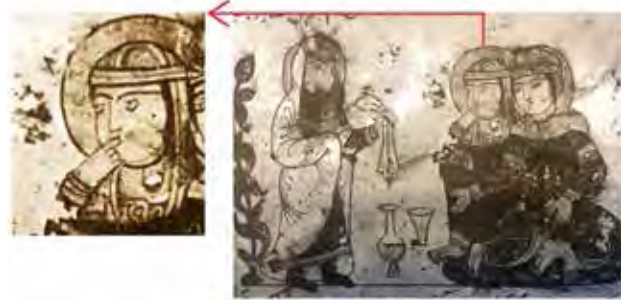
تصویر ۱. قسمتی از نگاره شکایت زن از همسرش، الحیوان جاحظ، کتابخانه امبروزیانا، میلان.

قرن است این نکته روشن می‌شود که اگر این واکنش حالتی خاص از رفتار ایرانیان بوده است چرا در سفرنامه ابن بطوطه به هنگام عبور از سرزمین‌های ایران آن زمان نیز به این واکنش رفتاری در ایرانیان اشاره‌ای نشده است. جالب توجه است که ابن بطوطه برای بیان شگفتی مخاطب از همان فعل «عجب» استفاده کرده است که ریشه تعجب نیز از همین فعل عربی است. به‌طور مثال در باب قتل «شیخ حیدری» در این سفرنامه آمده است: «هنگامی که دژخیم شمشیر بر سر او فرود آورد کارگر نیفتاد و مردم سخت بشگفت اندر شدند» (ابن بطوطه، ۱۳۷۶، ج ۲، ۱۱۲). در متن اصلی چنین آورده شده: «و عجب الناس لذلك و..» (ابن بطوطه، ۱۴۰۷، ج ۳، ۱۹۲). نمونه‌ای از این اصطلاح در قرن نهم هجری را باید در «خردنامه اسکندری» جست. آنجا که خاقان چین تحفه حقیقیر برای اسکندر فرستاد و «سکندر چو آن تحفه‌ها را بدید * سرانگشت حیرت به دندان گزید» (جامی، ۱۳۸۶، ۹۷۲). نمونه‌هایی از این اصطلاح را در قرن دهم هجری می‌توان در ابیات «محتشم کاشانی» دید: کنون او ذوق دارد محتشم از کردهای من * من انگشت تأسف می‌گزم که این‌ها چرا کردم (محتشم، ۱۳۸۷، ۵۸۷). نمونه‌ای دیگر از این اصطلاح به‌صورت نقاشی را در شاهنامه «تهماسی» می‌توان دید. بهرام گور با یک تیر دو گورخر را بهم می‌دوزد و لشکریان از این هنرنمایی به شگفت می‌آیند. تاریخ این شاهنامه حدود ۹۳۱