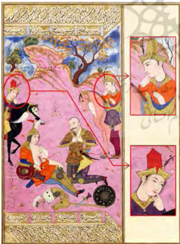
تصویر ۴. رستم و سهراب، از شاهنامه فردوسی، رقم معین مصور، اصفهان.

تا ۹۴۱ هجری قمری (۱۵۲۵-۱۵۳۵ م.) است (گرابر، ۱۳۹۰، ۹۹-۹۸). در قسمت بالای این نقاشی فردی از شدت تعجب این ماجرا، انگشت گزیده است (تصویر ۳).