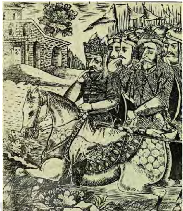
تصویر ۵. ذوالقرنین (اسکندر) در حال مشاهده قوم عجیب یا جوج و مأجوج، خمسه نظامی.