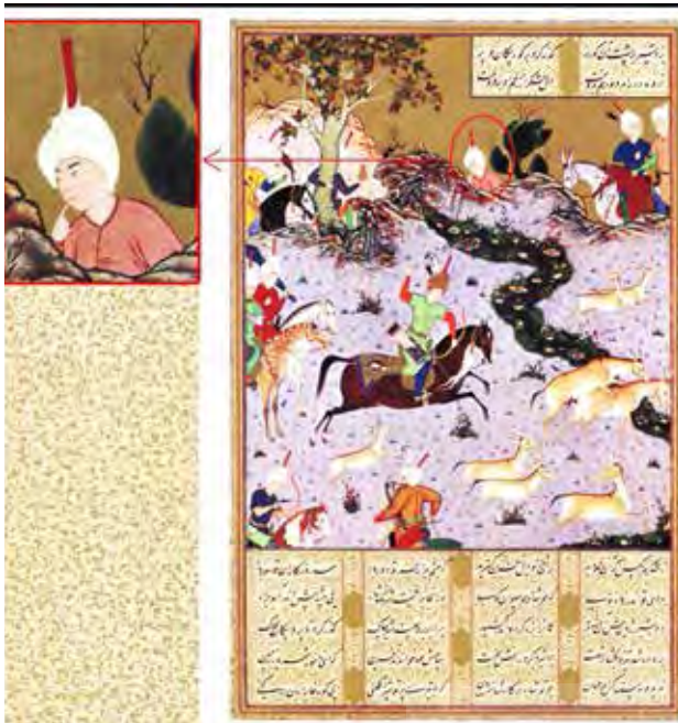
تصویر ۳. شکار دو گورخر با یک تیر توسط بهرام گور، شاهنامه تهماسبی.