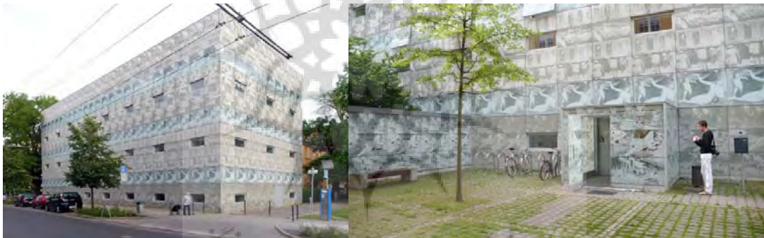
تصویر: کتابخانه دانشکده فنی ابرسوالد، هرزگ و دمورن، آلمان، ۱۹۹۹.