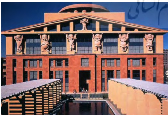
تصویر: ساختمان تیم دیزنی اثر مایکل گریوز در کالیفرنیا (۹۱ - ۱۹۸۵)

رابرت ونتوری هم، با یک خوانش پسامدرنیستی، بناهای لویی کان را به‌واسطه سرشار بودن از ارجاعات تاریخی، و استفاده جسورانه از نمادها و لایه‌های تاریخی تحسین می‌کرد. و یا با یک خوانش پسامدرنیستی از نوع نشانه‌شناسی پسا‌ساختارگرا، ساختمان تیم دیزنی اثر مایکل گریوز در کالیفرنیا (۹۱ - ۱۹۸۵) را می‌توان با لایه‌های پنهان و دلالت‌های ضمنی‌ای چون ادبیات داستانی، سرزمین رویاها، بینامتنیتی از کاراکترهای کارتون‌های کمپانی دیزنی و ترامنتیتی از کاریاتیدهای معبد یونانی ارختوم، نمادگرایی و غیره مورد خوانش قرار داد؛ این لایه‌ها در کنار مفاهیم آشکار و دلالت‌های عینی‌ای چون کاربری، استحکام و غیره خوانده می‌شود.