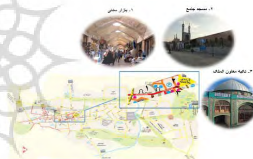
شکل ۱: موقعیت خیابان مدرس در شهر کرمانشاه

چنانی، طرح احداث آن به اجرا درآمد. نتیجه این اقدام، تقسیم شدن بازار به دو پاره شرقی و غربی بود. علاوه بر این، گذرهای درون بافت قطع و خیابان پس از عبور از مقابل مسجد جامع و وسط سبزه میدان با از بین بردن این فضای شهری، شاخه‌های اصلی بازار را قطع نمود. با ایجاد واحدهای تجاری، جداره‌سازی و کاشت پوشش گیاهی، این خیابان به مرکز اقتصادی شهر تبدیل شد. جذابیت مغازه‌های تجاری ساخته شده در بدنه خیابان مدرس موجب رونق این مغازه‌ها و کم رونق شدن واحدهای بازار گردید و بسیاری از بازاریان صاحب نفوذ به سمت واحدهای تجاری بر خیابان مدرس کشیده شدند. از مهم‌ترین بافت‌های تاریخی و دیدنی این منطقه می‌توان به مسجد جامع، کلیسای قلب مسیح مقدس، مسجد و حمام حاج شهپازخان، تکیه و حمام بیگلربیگی و غیره اشاره نمود (برومندسرخابی، ۱۳۸۸: ۲۸۳). شکل ۱ جایگاه منطقه مورد نظر (خیابان مدرس) و برخی ابنیه قدیمی را در شهر کرمانشاه نشان می‌دهد.