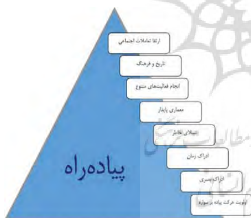
شکل ۳. مزایای ایجاد راهبرد پیاده‌راه در خیابان مدرس کرمانشاه با توجه به اهداف پژوهش

تعاملات اجتماعی و اجتماع‌پذیری در راستای ارتقای حضور پذیری انسان در فضای شهری می‌باشند و این نکته در مطالعات آنت (۱۹۵۸)، زوکر (۱۹۵۹)، جیکوبز (۱۹۶۱)، وایت (۱۹۸۰)، گل (۱۹۸۷)، اولدنبرگ (۱۹۸۹)، مارکوس (۱۹۹۰)، مدنی‌پور (۱۳۸۷) و معینی (۱۳۸۵) مورد تأکید قرار گرفته است و از طرفی افزایش تعامل‌پذیری اجتماعی می‌تواند امری باشد که مردم را به حضور در فضا تشویق نماید. مؤلفه‌های بیان‌شده در طراحی فضاهای شهری از جمله خیابان مدرس کرمانشاه، سبب ارتقای تعاملات اجتماعی و اجتماع‌پذیری انسان و محیط می‌گردند که این امر سبب ایجاد و افزایش اجتماع‌پذیری فضا گردیده و باعث ارتقای کیفیت تعاملات و کسب رضایت‌مندی و آرامش روانی کاربران می‌گردد. با توجه به اینکه خیابان مدرس کرمانشاه مهم‌ترین مرکز اقتصادی و اجتماعی مردم می‌باشد، جهت ارتقای تعاملات اجتماعی انسان و محیط پیشنهاد می‌گردد با بکارگیری مؤلفه‌های ذکر شده توسط برنامه‌ریزان و متخصصین شهری، علاوه بر ایجاد تعاملات اجتماعی و اجتماع‌پذیری انسان و محیط، سبب احیای ارزش‌های فرهنگی - تاریخی منظر شهری گردد.