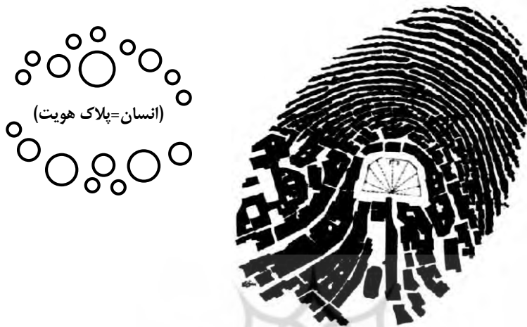
شکل ۲- پلاک هویت شهری

هویت شهری را می‌توان از چند بعد کالبدی و طبیعی، انسانی و سرمایه اجتماعی، ۱۷ تاریخی و اقتصادی بررسی نمود. هویت مکان در اثر تجربه مستقیم محیط فیزیکی و محک زدن فضا به وجود می‌آید و بازتابی از وجوه اجتماعی و فرهنگی مکان است. هویت مکان به ویژگی‌های قابل تشخیص مکان اشاره دارد درحالی‌که هویت مکانی احساسی در یک فرد و یا جمع است که به واسطه ارتباط با یک مکان برانگیخته و باعث افزایش انرژی در افراد می‌شود (رضازاده، ۱۳۸۰: ۲۷-۲۳). هویت شهری بخشی از زیرساخت هویت انسان و حاصل از شناخت‌های انسان‌ها در زندگی برخوردار بوده است. عوامل و عناصر هویت بخش یک شهر بسیار گسترده و حائز اهمیت هست هویت شهر بر پایه مؤلفه‌های تشکیل‌دهنده اجزاء و شکل‌دهنده فضا می‌باشد، که عبارت‌انداز: مؤلفه‌های طبیعی، مصنوعی و انسانی که هر کدام صفات و متغیرهای ویژه خود را داراست. که با به‌هم‌پیوستن این اجزاء پلاک هویت شهری را می‌توان به وجود آورد طبق (شکل ۲)، نشانه این موضوع می‌باشد.