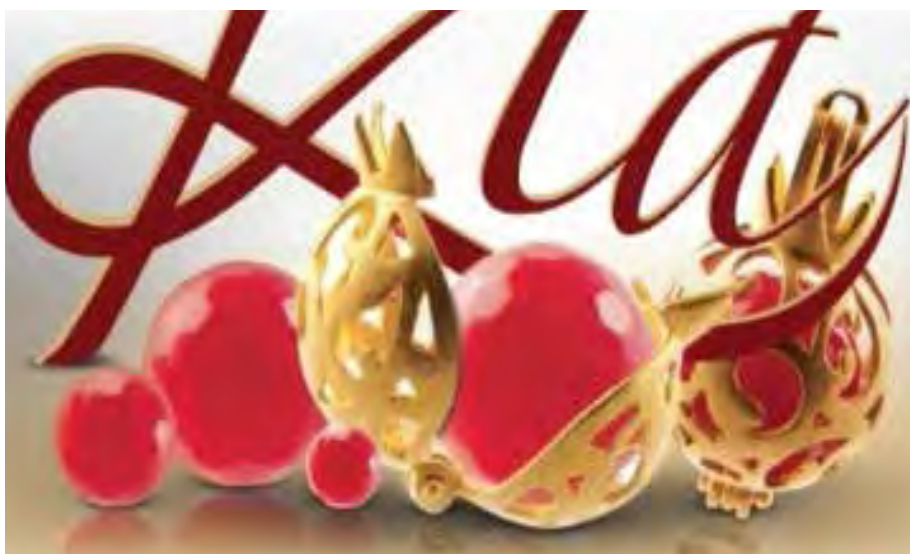
تصویر ۲. انار در نمونه گونه شارژ، طراحی شده کیاگالری. مأخذ: www.kiagallery.com .