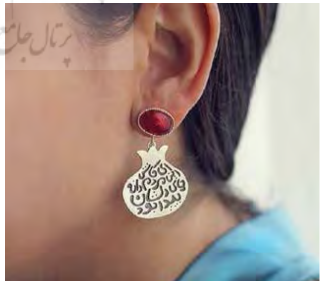
تصویر ۵. انارهای ترانسپوزسیون پارودیک اثر مریم خزعلی. مأخذ: صفحه شخصی هنرمند فوق در Instagram.