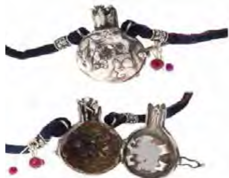
تصویر ۱. نمونه انار پاستیشی معاصر.

نخستین گام در بررسی آثار یک حوزه، طبقه‌بندی آنها در یک نظام و سپس تحلیل آن است؛ چرا که لازمه یک مطالعه نظام‌مند، گونه‌شناسی است. بدون گونه‌شناسی و دسته‌بندی امکان دریافت، مطالعه و در نهایت خلق آثار جدید غیرممکن می‌شود. با استفاده از گونه‌شناسی بیش‌متنی، زیورآلات معاصر ملهم از نقش‌مایه انار مورد بررسی قرار گرفته است. همانگونه که قبلاً مطرح نظر قرار گرفت، گونه‌شناسی بیش‌متنی براساس تغییر در سبک و کارکرد به دو گونه تراگونگی (تغییر) و همان‌گونگی (تقلید)، در شش گروه طبقه‌بندی شده است (نامورمطلق، ۱۳۹۱، ۱۴۲)، که جهت جلوگیری از اطاله مطلب در خصوص موضوع پژوهش به تفصیل باز شده است. پاستیش ۳۴ : از حوزه هنرهای تجسمی به قلمرو مطالعات بیش‌متنی راه یافته است. در این شیوه سبک پیش‌متن به صورت آگاهانه مورد تقلید قرار می‌گیرد، تمرکز و تأکید بر حفظ سبک پیش‌متن است که اغلب با موضوعی متفاوت انجام می‌شود. کارکرد پاستیش تفننی است و با تغییر اندک در پیش‌متن انجام می‌شود (همان، ۱۴۸). تصویر ۱ با الهام از نقش‌مایه انار در عصر حاضر طراحی شده است. هنرمندان با حفظ سبک اثر که همان ویژگی‌های فرمی حجم سه‌بعدی ارابه شده در دوره هخامنشیان بوده، اثری جدید خلق کرده است. در این نمونه‌ها پیکره انار محتوی طرح‌های مرصع‌نشان فلزی است که تصاویر قلب و عناصر گیاهی بر روی آن بافته شده است. در تصویر سمت راست، هنرمند انار را به عنوان عنصری در غیاب از عشق و علاقه گرفته و به نمادی از عشق تبدیل کرده است. در نمونه سمت چپ با اناری مواجه هستیم که جنبه آیکونیک آن غیرقابل انکار است، اما حال آنکه این انار به عنوان فضای نگهداری عکس یادگاری به کاررفته است و به ابژه‌ای بدل شده که جانشین خاطرات فرد شده و به نوعی به استعاره