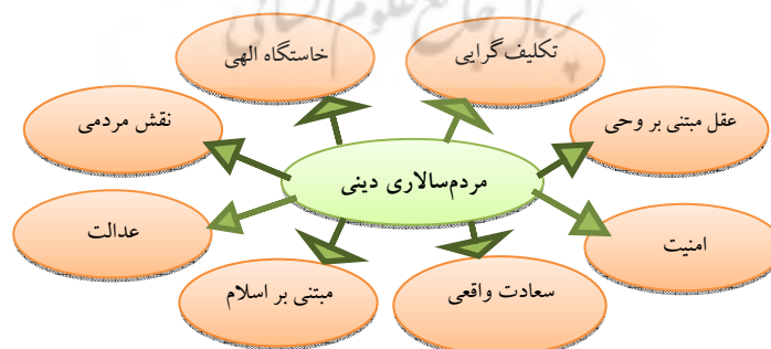
نمودار ۱. ویژگی‌های مردم‌سالاری دینی

- نظام مردم‌سالاری دینی، حکومتی مبتنی بر عقل است. حکومتی منطقی و معقول و به دور از ستیزه‌گری و سلطه و تحمیل (بیانات، ۶۰/۱۷/۱۰).