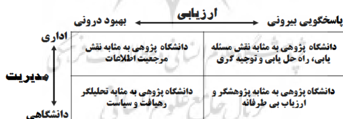
نمودار 2: چارچوب مفهومی دانشگاه پژوهی (ولکواين، 1999)