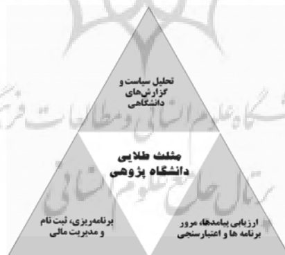
نمودار 1: مثلث طلایی دانشگاه پژوهی (ولکواين، 2008)

ولکواين 3 از جمله صاحب‌نظرانی است که مطالعات ارزشمندی طی دهه‌های اخیر در حوزه دانشگاه پژوهی انجام داده است. ولکواين (2008) کارویژه‌های دانشگاه پژوهی در دانشگاهها را در قالب مثلث طلایی دانشگاه پژوهی (مشمول بر: الف) تحلیل سیاست و گزارشهای دانشگاهی، (ب) برنامه‌ریزی، ثبت نام و مدیریت مالی، (ج) ارزیابی پیامدها، مرور برنامه‌ها و اعتبارسنجی، تعریف کرده است. وی معتقد است که پرجمع‌ترین فعالیتهای واحد دانشگاه پژوهی در دانشگاهها، مربوط به ارزیابی پیامدها، مرور برنامه‌ها و اعتبارسنجی است (همان). واحدهای دانشگاه پژوهی در این بخش، اقداماتی نظیر اعتبارسنجی، تضمین کیفیت و ارزیابی درونی و بیرونی را در دانشگاهها دنبال می‌کنند که به طور مستقیم با مأموریت‌های اصلی دانشگاه پژوهی، که همان بهبود درونی و پاسخگویی بیرونی در راستای ارتقای کیفیت و اخلاق در دانشگاهها بوده، مرتبط است. (نمودار 1)