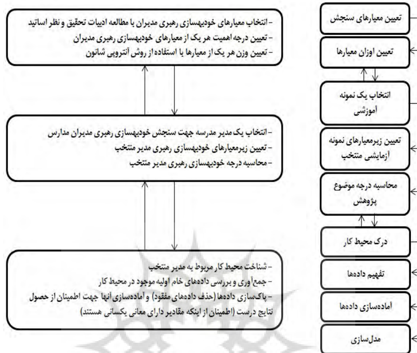
شکل 2. گام‌های داده‌کاوی و مدل مفهومی تحقیق

متفاوت شناسایی شد. شکل 2 مدل مفهومی کشف دانش از بانک داده متغیرها در این تحقیق را نشان می‌دهد.