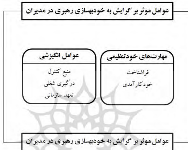
شکل 1. مدل مفهومی تحقیق

خودبهبه‌سازی رهبری متناسب با ماهیت متغیرها و شیوه قضاوت انسانی در مدارس دولتی شهر اصفهان، موجبات نوآوری را فراهم ساخته است. به منظور نیل به اهداف فوق و با بهره‌مندی از رویکرد داده‌کاوی، مقاله حاضر در صدد پاسخ به این سوال است که طراحی مدل خودبهبه‌سازی رهبری در مدیران مدارس دولتی شهر اصفهان چگونه است؟