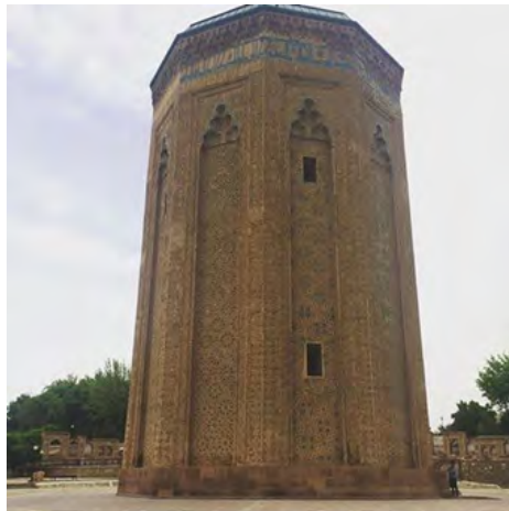
شکل (۶) مقبره مؤمنه خاتون

بررسی مقابر دوره سلجوقی (نمونه موردی) مقبره سه گنبد ارومیه) سیده فائزه موسوی، مرتضی خسرونی صص ۴۴-۳۳