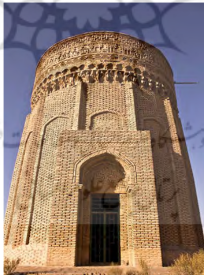
شکل (۵) برج طغرل مأخذ گنج نامه مقابر

پوشش آجری که از سده پنجم هجری (یازدهم میلادی) به بعد در آرامگاه های عهد سلجوقی به کار رفته، بعدها به صورت یک خصوصیت عمومی معماری در مناره ها، درگاه ها، قبه ها و دیگر قسمت های بنا مورد استفاده قرار گرفته است. در بعضی از آرامگاه ها، آجر به رنگ های قرمز توأم با کاشی های فیروزه فام با کار برده شده است؛ که بهترین نمایش ترکیب این دو عنصر معماری و تزیینی را در گنبد های سرخ و مراغه می بینیم. در اواخر دوران سلجوقی این تزیینات به مرور جای خود را به گچبری و کاشی کاری می دهند که این عناصر تزیینی خود تکنیک های زیبایی به هنر معماری عرضه می دارند. (۱)