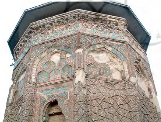
شکل (۷) گنبد کبود مراغه (۱)

این تزیینات برای اولین بار در دوره سلجوقی در نمای شمالی و بین طاق نماهای مدخل ورودی بدنه ستونچه‌های چهارگوش گنبد سرخ مراغه به کار رفته. اجرهای لعابدار که در زیر قوس پیشانی مدخل این بنا استفاده شده به رنگ فیروزه‌ای و در طرح بسیار زیبایی هندسی نمایش داده شده است. در وسط این طرح ستاره مانند، یک کاسه لاجوردی رنگ جای گرفته که ترکیب این دورنگ دارای یک ویژگی استثنایی است. اختلاط کاشی فیروزه‌ای و آبی در زمینه آجرهای قرمز از امتیازات مهم این آرامگاه است. اوج شکوفایی این هنر زیبا را در اواخر سده ششم هجری و در آثار این دوره می‌بینیم زیرا در این زمان تزیینات رنگی بیشتر در نمای خارجی و سطح گنبدها به مقدار زیاد به کار رفته است. مقبره مؤمنه خاتون در نخجوان و گنبد کبود مراغه - دواثر زیبا یا اواخر زمان سلجوقیان - باینهنرازنده آرایش یافته است. در این مقبره‌ها برای بیشتر جلوه دادن کتیبه‌ها از کاشی فیروزه‌ای رنگ برجسته استفاده شده است. (۱)