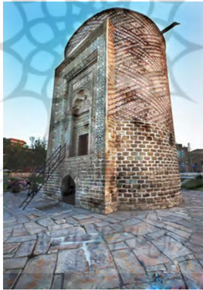
شکل (۹) مقبره سه گنبد