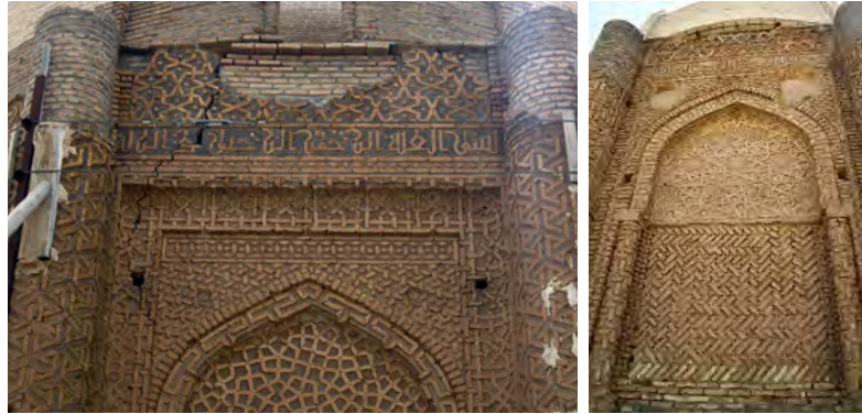
شکل (۴) تزیینات آجری برج های خرقان

بنا ارتباط چندانی ندارند، به همین دلیل بیشتر تزیینات آجری نماها در داخل و خارج فروریخته است. نمای خارج برج دماوند و برج خرقان و مقبره خواجه اتابک از نمونه های این نوع تزیین است.