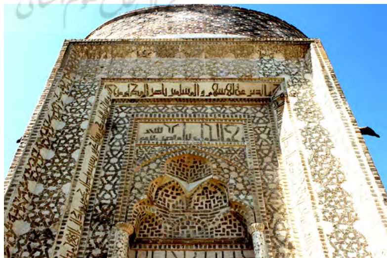
شکل شماره (۱۱) تزئینات سردر ماخذنگارنده

تنها قسمت اثر که دارای تزئینات می‌باشد، ورودی اطاق مقبره است که با قابسازی بسیار جالب و با نصب سنگ‌های ظریف تراش در گچ کتیبه‌های اطراف سردر ورودی اطاق مقبره را آرایش داده‌اند و این نوع قابسازی و کتیبه‌نویسی (نصب سنگ‌های ریز در گچ) در نوع خود بی‌نظیر است، قسمت داخلی بنا فاقد هرگونه تزئینات می‌باشد. آندره گدار، این بنا را در ردیف ابنیه مراغه و بین برج مدور (۵۳۶) هجری و گنبد کبود (۵۳۹) هجری) قرار می‌دهد و می‌نویسد: با وجود اینکه در آن زمان استعمال تزئینات کاشی رواج داشته و در مقبره مؤمنه خاتون در نخجوان که در ۵۲۸ ساخته شده کاشی به کار رفته، در این مقبره کمترین اثری از رنگ‌آمیزی به نظر نمی‌رسد.