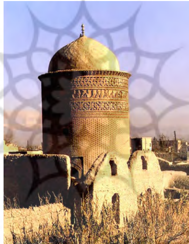
شکل (۳) برج پیر علمدار چهل دختران دامغان

برای پوشش سقف در مقبره‌های چهارگوش و مکعب شکل ابتدا چهارگوشه را به هشت‌گوش و سپس شانزده گوش و نهایتاً به حد دایره نزدیک ساخته‌اند به طوری که خیلی راحت گنبد را بر بدنه ده ضلعی بنا کرده‌اند. برای این کار از گوشه‌ها استفاده کرده و برای پوشش گوشه‌ها دو روش پدید آورده‌اند که یکی را شکنج و دیگری راترنه می‌گویند. وجود این ترنیه‌ها و مقرنس‌های مثلی شکل در گوشه‌ها، برای ایجاد پایه قبه به شکل چمبر مؤثر بوده است. این چمبر که خود یک دیوار ساده یا تزئینی نمایش داده شده است در حقیقت دامنه اصلی گنبد را فراهم می‌سازد که بر فراز آن پوشش خارجی آرامگاه جای گرفته است. (۱)