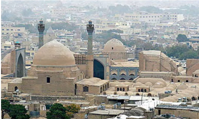
بررسی مقابر دوره سلجوقی (نمونه موردی) مقبره سه گنبد ارومیه) سیده فائزه موسوی، مرتضی خسرونی صص ۳۳-۴۴