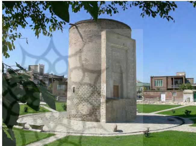
شکل (۸) مقبره سه گنبد

سه گنبد نام تپه‌ای در جنوب شرقی شهر ارومیه مرکز استان آذربایجان غربی است، این بنا آرامگاه بود و در سال ۵۸۰ قمری در جنوب شرقی ارومیه ساخته شد. مقبره یا برج آجری سه گنبد متعلق به قرن ششم هجری بوده و در مدخل بنا سه کتیبه به خط کوفی باقی مانده است. برخی از مورخین عقیده دارند که این بنا به جای آتشکده‌ای از دوره ساسانی احداث شده است، ولی هیچ‌گونه سند معتبری مبنی بر صحت ادعای خود ندارند. از سوی دیگر در مدخل بنا سه کتیبه موجود است که از سنگ تراشیده شده و در پایان کتیبه، محرم سال ۵۸۰ هجری خوانده می‌شود.