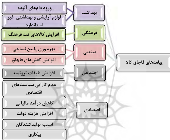
شکل شماره ۲. مدل پیامدهای قاچاق کالا

برای دستیابی به اقتصادی توانمند و در تعامل مثبت و مؤثر با اقتصاد منطقه‌ای و جهانی در جهت ایجاد رفاه و آسایش مردم و پیشرفت کشور (عیسوی، ۱۳۹۶، ص ۲۹).