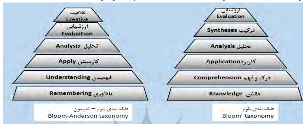
شکل ۱ مقایسه طبقه‌بندی بلوم و طبقه‌بندی بازنگری شده بلوم - اندرسون

مانند طبقه‌بندی سولو، طبقه‌بندی مریل، طبقه‌بندی گانیه و طبقه‌بندی مارزانو است. همچنین وسعت کاربرد این طبقه‌بندی در پژوهش‌های حوزه یادگیری الکترونیکی قابل مقایسه با هیچ‌کدام از طبقه‌بندی‌ها نمی‌باشد. شکل ۱ مقایسه این طبقه‌بندی را با طبقه‌بندی بلوم نشان می‌دهد.