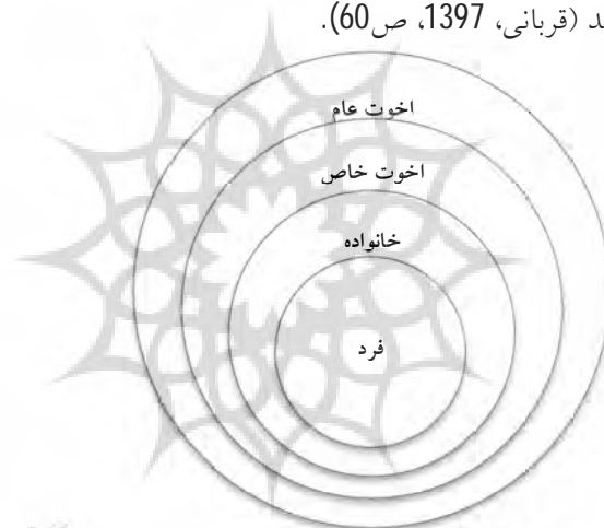
شکل 3: نظام روابط افراد در اسلام

اقتصاد خانواده: در جامعه اسلامی، حقوق فردی، خانوادگی، اقوام و خویشان، همسایگان و افراد محل، دوستان و دیگر مسلمانان باید هم‌زمان مورد توجه قرار گیرد و نباید همه جامعه را به یک‌شکل دید (قربانی، 1397، ص 60).