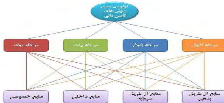
نمودار ۱. نمودار سلسله مراتبی تصمیم‌گیری

مرحله اول: ترسیم نمودار سلسله مراتبی تصمیم‌گیری