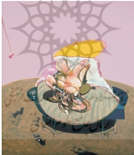
شکل ۲: فیگور دراز کشیده، فرانسیس بیکن، ۱۹۶۹. خط مرز نما در اینجا به صورت بیضی زرد رنگ دیده می‌شود.