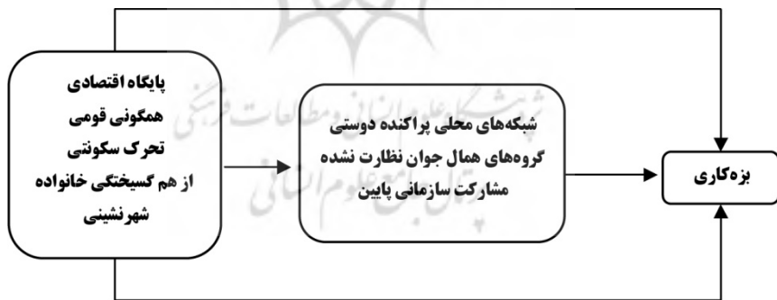
مدل ۱: مدل سامپسون و گروز از بی‌سازمانی اجتماعی

شاو و مکی ۱ (۱۹۴۲) مانند پارک و برگس به این موضوع پرداختند که چگونه ویژگی‌های ساختاری محله بر وقوع بزه‌کاری در میان قلمروهای محله‌ای اثر می‌گذارد، آن‌ها به‌طور خاص بر اثرات چهار وضعیت ساختاری بر میزان‌های بزه‌کاری توجه نشان دادند: پایگاه اقتصادی- اجتماعی پایین، عدم تجانس قومیتی، تحرک سکونتی و از هم گسیختگی خانوادگی. وجود این ویژگی‌ها نشانگر بی‌سازمانی اجتماعی است. شاو و مکی مانند توماس و زنائیکی معتقدند که بی‌سازمانی اجتماعی توانایی محلات شهری را برای تنظیم خودش از طریق کنترل‌های اجتماعی غیر رسمی کاهش می‌دهد، آن‌ها در مطالعه خود به متغیرهای دیگری مانند ترک تحصیل، میزان‌های مجرمان جوان، میزان‌های مرگ و میر نوزادان، میزان بیماری سل و میزان‌های اختلالات روانی اشاره می‌کنند (رینبرگر ۲ ۲۰۰۳: ۹). علاوه بر این، به نظر شاو و مکی محلات با ویژگی بی‌سازمانی و دارای میزان‌های بالای کجروی دارای ویژگی‌های دیگری نیز می‌باشند، از جمله: رشد بالای جمعیت، درصد بالای خانواده‌های نیازمند ترمیم ۳ ، میزان پایین مالکیت خانه، میزان پایین اجاره بها و پرسه زنی ۴ . از نظر شاو و مکی بزه‌کاری با ساختار فیزیکی و سازمان اجتماعی شهر دارای رابطه است. به‌طور کلی در شکل کلاسیک از این مفهوم، شرایط بوم‌شناختی، شبکه‌های تعاملی را که ظرفیت تنظیم‌کنندگی محله را حفظ می‌کند، تخریب می‌کند که این حالی افزایش انحرافات اجتماعی را به دنبال دارد (کلوارد و اوهلین ۵ ، ۱۹۶۰: ۲۸۵).