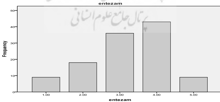
نمودار ۱: توزیع فراوانی نظرات پاسخ دهندگان (فرضیه اول)