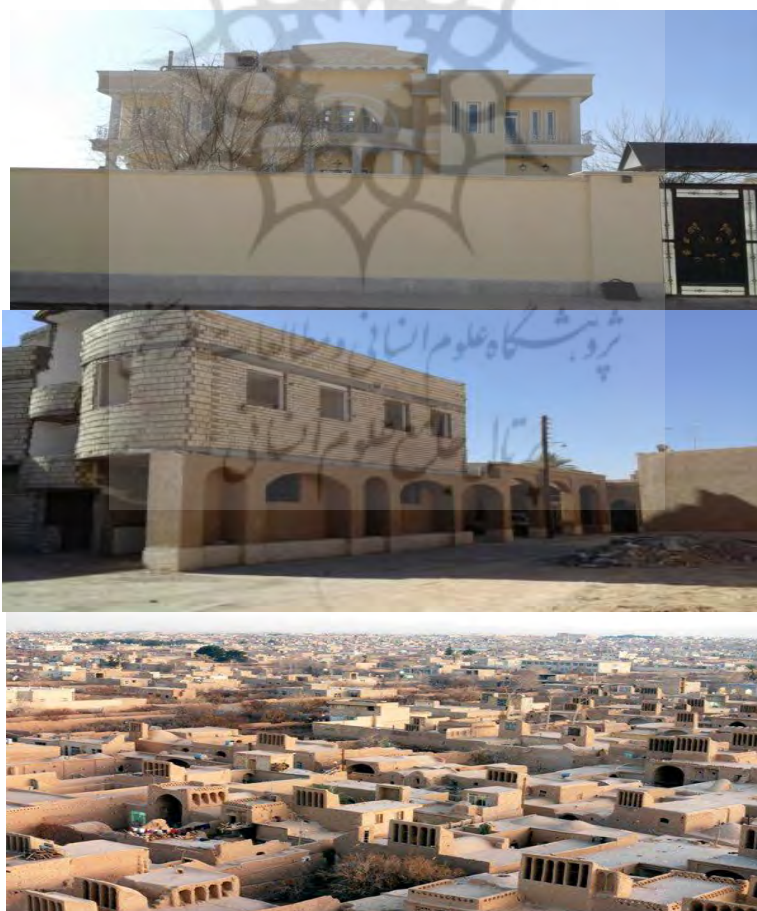
شکل ۲. نمونه یک مسکن با تلفیق فناوری امروزی و ساخت و معماری سنتی بومی

این شاخص در ۵ مؤلفه ارزیابی می‌شود. جدول ۱۰ نشان می‌دهد بالاترین مقدار میانگین رتبه به محله ۲۲۲ و سپس محله ۱۱۳ مربوط است. محله ۲۲۲ از محله‌های جدید شهر میبد است که بافت مسکونی جدید، دسترسی مناسب و خدمات نسبتاً مناسبی دارد. محله ۱۱۳ نیز از محله‌های مهم و پرجمعیت شهر میبد محسوب می‌شود که خدمات مناسبی در آن وجود دارد. کمترین مقدار میانگین رتبه نیز به محله ۱۱۱ و سپس محله ۲۱۱ مربوط است. محله ۱۱۱ محله‌ای حاشیه‌ای است و خدمات مناسبی ندارد. محله ۲۱۱ هم محله‌ای قدیمی است و بافتی قدیمی و فرسوده دارد. همچنین دسترسی در این بافت پایین است و خدمات برای جمعیت چندان مناسب نیست.