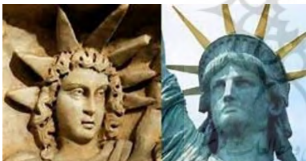
نقش برجسته میترا و مجسمه آزادی.