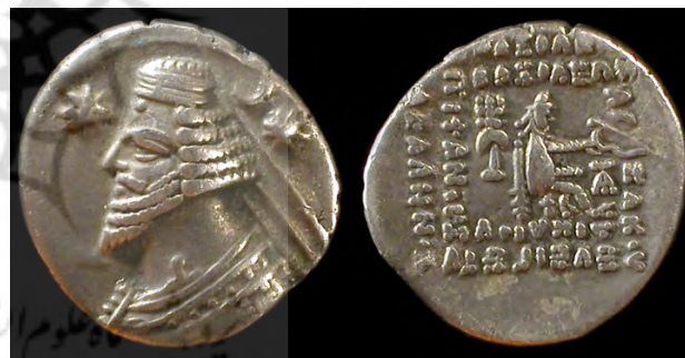
سکه اشکانی، ارد دوم.