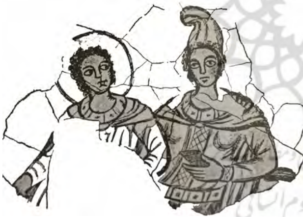
تصویر ۳. میترا با کلاه فریجی و جام دوستکامی-سل خدای خورشید با هاله نور.

عدالت و رهبری مردم به آسمان عروج کرده و روز قیامت همچون مسیح (ع) برای شفاعت پیروان به زمین بازمی‌گردند (تصویر ۴).