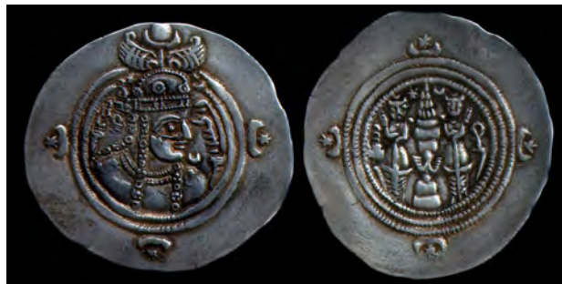
سکه ساسانی با نقش هلال ماه، ستاره و قرص خورشید. مأخذ : اورزمانی و سرفراز، ۱۳۸۳.