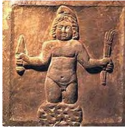
تصویر ۲. زایش میترا از سنگ با مشعل و خنجر.

عدالت و رهبری مردم به آسمان عروج کرده و روز قیامت همچون مسیح (ع) برای شفاعت پیروان به زمین بازمی‌گردند (تصویر ۴).