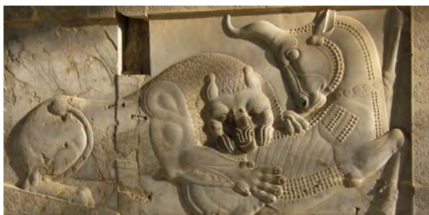
تصویر ۴. غلبه نمادین شیر بر گاو. میترا گاو را قربانی کرده در نبردی غیر خصمانه پایان زمستان و آغاز بهار را نوید می‌دهد.

پیشاهنگان لباس رسمی داشته و به ورزش و تمرینات بدنی می‌پرداختند.