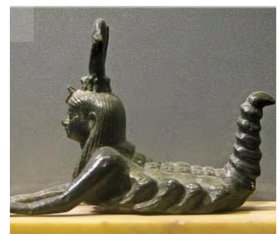
تلفیق زن و عقرب در مجسمه مصری.