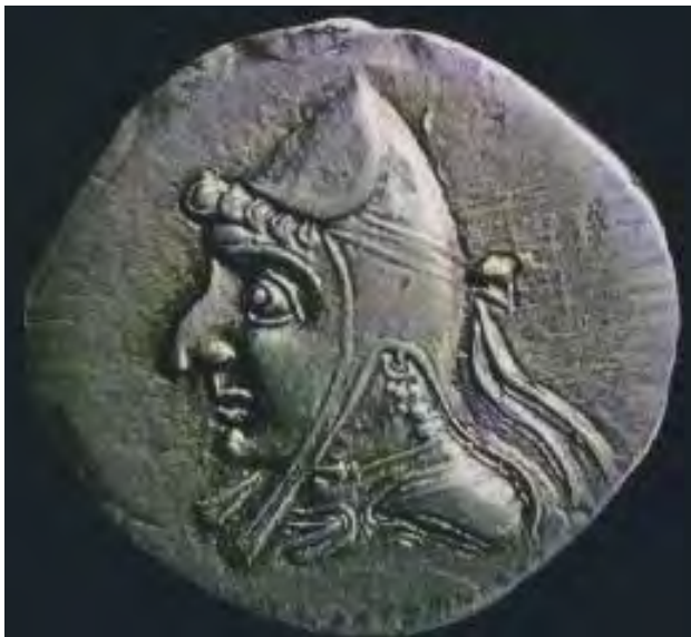
سکه اشکانی.