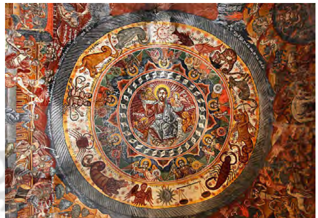
نقش صور فلکی در کلیسا.