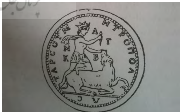
سکه‌های رومی، میترا با تاج خورشید.