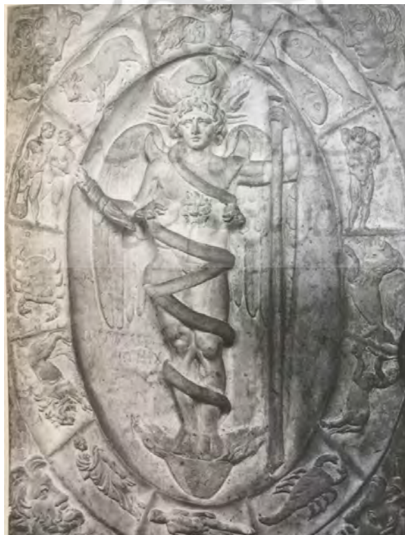
نقش صور فلکی و بروج دوازده‌گانه در مهرابه.

تصویر ۶. نقوش صور فلکی در کلیسا و مهرابه.