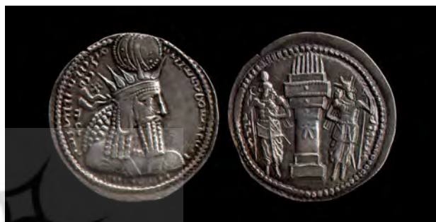
سکه ساسانی، تاج شاه با شعاع‌های نور.