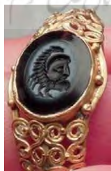
عقرب در نگین انگشتر.