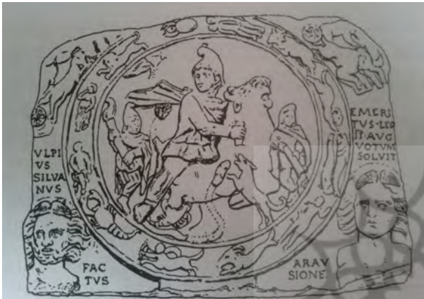
نقش صور فلکی و بروج دوازده‌گانه در مهرابه.

کیش مهر در میان آریاییان هند و ایران رایج بود و در دوران اشکانی و ساسانی به امپراطوری روم رفت. نشانه‌های آیین مهر در ایران و جهان با تفاوت‌هایی برخاسته از فرهنگ شرقی و غربی در نقاط مختلف جهان تاکنون برجاست. ردپای میترای در دوران اساطیری و تاریخی ایران سپس در دوران اسلامی تاکنون دیده می‌شود. آیین و فرهنگ مهر در جهان باستان پراکنده شده چنانکه