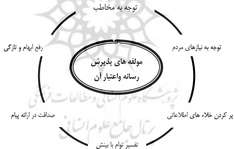
شکل ۴. مولفه‌های پذیرش رسانه و اعتبار آن از نظر کارشناسان

این مولفه‌ها در شرایط رقابت رسانه‌های جمعی و هنگامی که کنجکاوی جامعه نسبت به واقعه در برانگیختگی شدید می‌باشد، بسیار پراهمیت می‌شوند. نکته اصلی در این مرحله به حداقل رساندن فاصله زمانی حادثه و زمان‌های مربوط به گسترش آن از یک سو و آگاهی جامعه از سوی دیگر است.