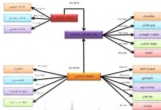
شکل ۳. ضرایب معنی داری t