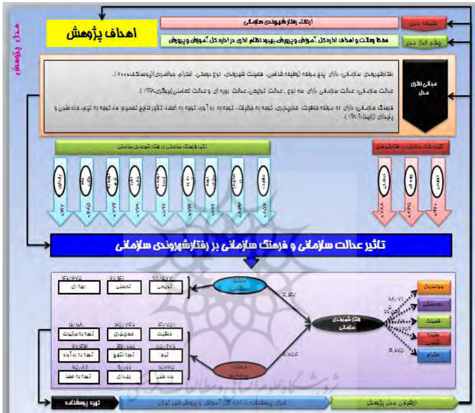
شکل ۱. مدل پژوهش

پژوهش حاضر به این سوال پاسخ دهد که: دو متغیر عدالت سازمانی و فرهنگ سازمانی در بروز رفتار شهروندی سازمانی در کارکنان اداره کل آموزش و پرورش استان تهران چه تاثیری دارند؟