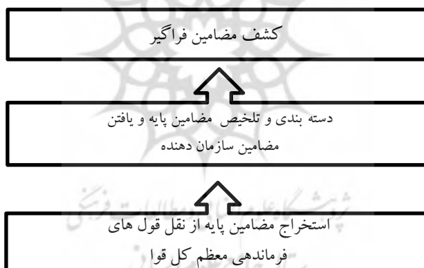
شکل ۱: الگوریتم تحقیق مطابق با شبکه مضمون آنراید- استیرلینگ

الگوریتم این تحقیق مطابق با شکل زیر با روش شبکه مضامین از روش‌های تحلیل مضمون ارائه می‌شود: