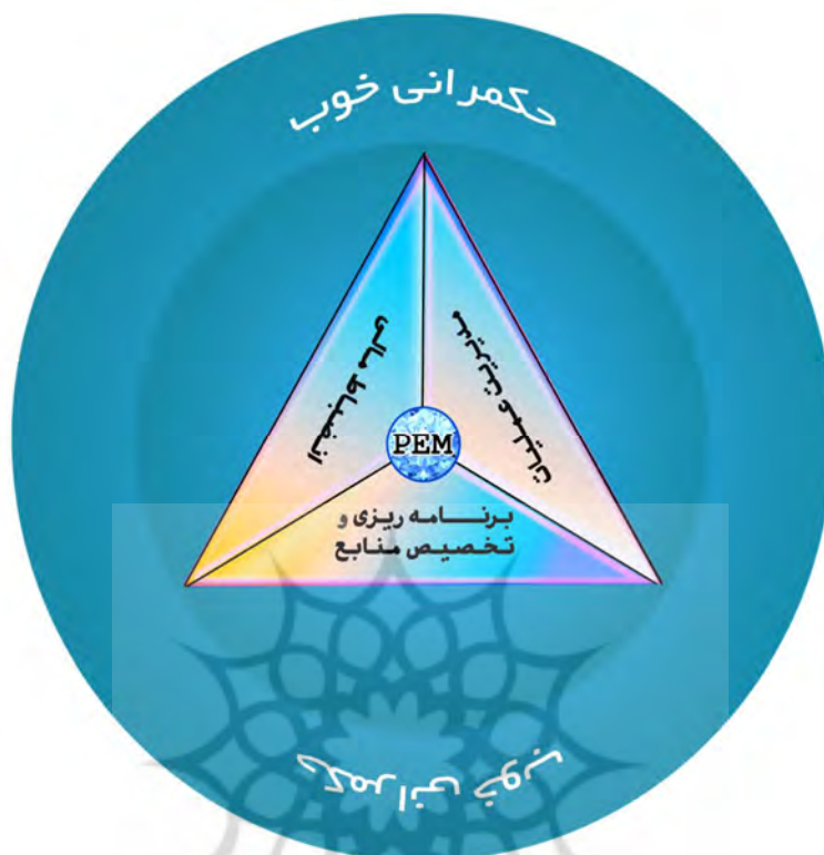
شکل ۱ الگوی برخاسته از ادبیات پژوهش (الگوی نظری)