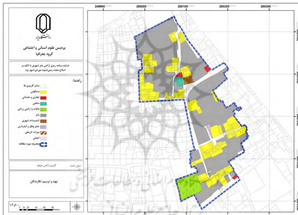
شکل (۲). کاربری اراضی محدوده مورد مطالعه