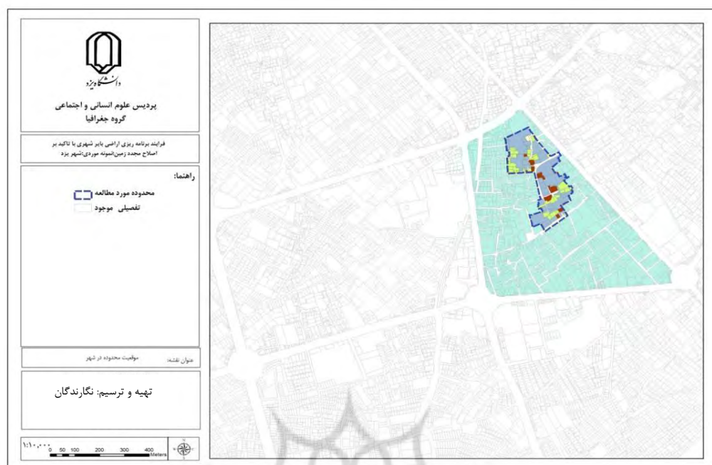
شکل (۱). موقعیت محدوده مورد مطالعه در شهر یزد

تحقیق حاضر از نظر هدف، یک تحقیق توسعه‌ای- کاربردی می‌باشد. از نظر گردآوری داده‌ها و اطلاعات و روش تجزیه و تحلیل یک تحقیق توصیفی- تحلیلی بوده که در بین انواع تحقیقات توصیفی، از نوع مطالعه موردی می‌باشد. اطلاعات مورد نیاز به طور عمده از منابع کتابخانه‌ای، نتایج سرشماری‌ها و طرح‌های توسعه شهری تهیه شده توسط مهندسين مشاور و قسمتی از طریق پیمایش گردآوری گردیده است. در ادامه، محدوده‌ای از شهر یزد که به نظر می‌رسد قابلیت استفاده از روش اصلاح مجدد در آن وجود دارد انتخاب و سپس محاسبات مربوط به این روش با استفاده از نرم‌افزارهای GIS و EXCEL انجام و طرح پیشنهادی برای محدوده ارائه گردیده است. در فرآیند اصلاح مجدد، ابتدا بایستی نرخ قابلیت محدوده محاسبه شود. اگر نرخ قابلیت مجموعه بزرگتر از عدد ۲ برآورد گردد، مطالعه میزان توجیه‌پذیری محدوده برای اصلاح مجدد زمین باید انجام گیرد. در مرحله بعد نرخ توجیه‌پذیری محدوده ( ) محاسبه می‌گردد. چنانچه \alpha < 1 باشد، این دسته از پروژه‌ها، ممکن است نیازمند کمک‌های مالی باشند. اگر 1/5 < \alpha < 1 باشد، بدان معناست که احتمال ناکامی طرح و وقوع نتایج مغایری با تراز مالی تدوین شده وجود دارد. در صورت \alpha > 1/5 ، بدان معناست که محدوده طرح، مناسب توسعه است. در ادامه بقیه شاخص‌های مورد نیاز محاسبه می‌گردند. جدول (۱) تمامی شاخص‌ها و نحوه محاسبه آنها را نشان می‌دهد.