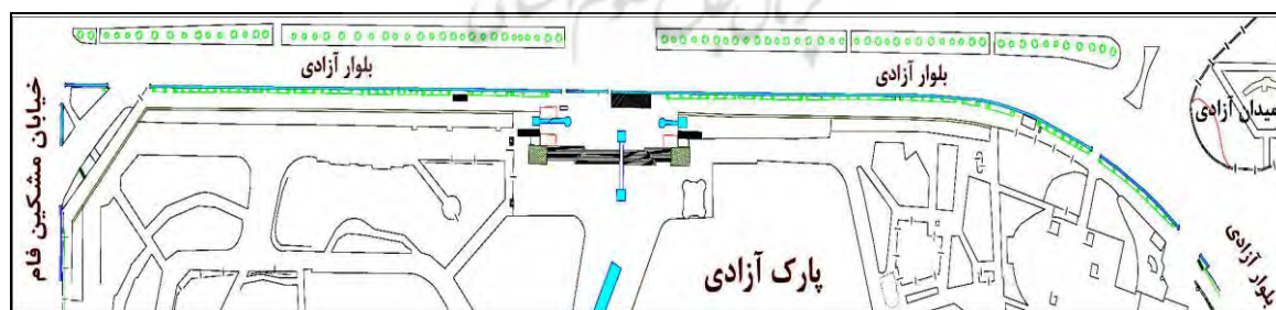
شکل ۳- موقعیت محدوده مورد مطالعه و پارک آزادی

محدوده مورد مطالعه در این تحقیق، پیاده رو ضلع شرقی بلوار آزادی حدفاصل فلکه گاز تا خیابان مشکین فام است (شکل ۳). طول این پیاده رو ۴۲۰ متر و عرض آن بدون در نظر گرفتن عرض باغچه‌ها از ۳/۵ متر تا ۱۳/۵ متر در محل ورودی اصلی پارک آزادی متفاوت است. (شکل ۳).