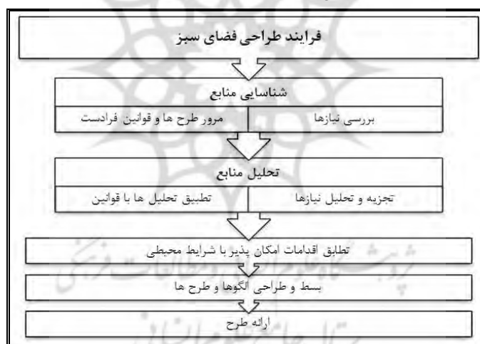
شکل ۱- فرایند طراحی فضای سبز

تعریف طراحی فضای سبز: در صورت به کارگیری اصول زیباشناختی در هر مرحله از فرایند و با ارتقاء کیفیت انسان‌مداری و افزایش پویایی و سازگاری عملکردی با خواسته‌های امروز، فضای شهری می‌تواند حیات اجتماعی و کارایی مجدد خود را کسب نماید و به فضایی منسجم و پیوسته و در ارتباط با بافت پیرامون خود تبدیل شود (نقی زاده و همکاران، ۱۳۹۲: ۱۱). فرایند طراحی فضای سبز در شکل شماره ۱ ارائه گردیده است.