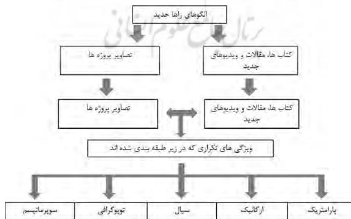
شکل ۱: روش شناخت الگوهای حدید در فرم طراحی

یک مطالعه کیفی برای شناسایی الگوهای حدید در طراحی فرم معماری با استفاده از تحلیل محتوا بر گفته های او از متون، فیلم و رونوشت های قابل دسترسی (شکل ۱) انجام شده است. تجزیه و تحلیل محتوا به عنوان یک روش تحقیق انتخاب شده است زیرا مجموعه ای از روش ها برای نتیجه گیری های قابل اعتماد و معتبر است. (Pole, C. and Lampard, R, ۲۰۰۲) همچنین یک روش فراگیر و منظم برای به دست آوردن داده های اولیه «بینش دست اول» فراهم میکند (Wong, J. ۲۰۱۰). علاوه بر این منبع ضروری در مورد اندیشه و رفتار انسانی است. (Bernard, R. H. ۲۰۰۰) حدید در طول سخنرانی های خود در حالیکه توصیف پروژه ها و همچنین ویژگی های غالب فرم را بیان میکند، از وقایع تکراری سخن میگوید. این ویژگی ها و کلمات تکراری میتواند تحت پنج الگوی به رسمیت شناخته شده طبقه بندی شود که عبارت اند از: سوپرماتیسم، توپوگرافی، سیال، ارگانیک و فرم پارامتری.