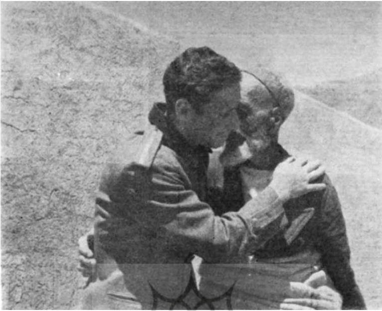
سپاهی دانش و دهقان