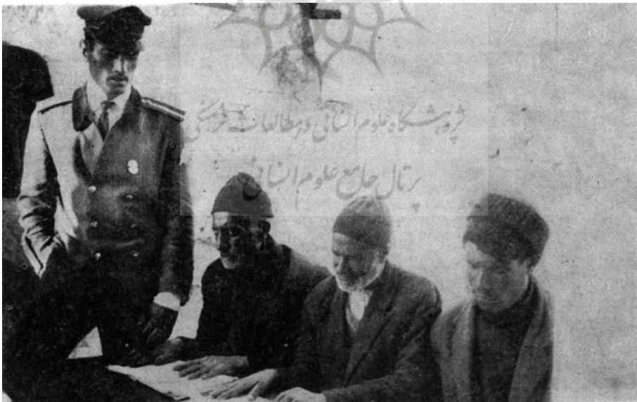
کلاس درس سالمندان قریه دهملا شهرستان الیگودرز