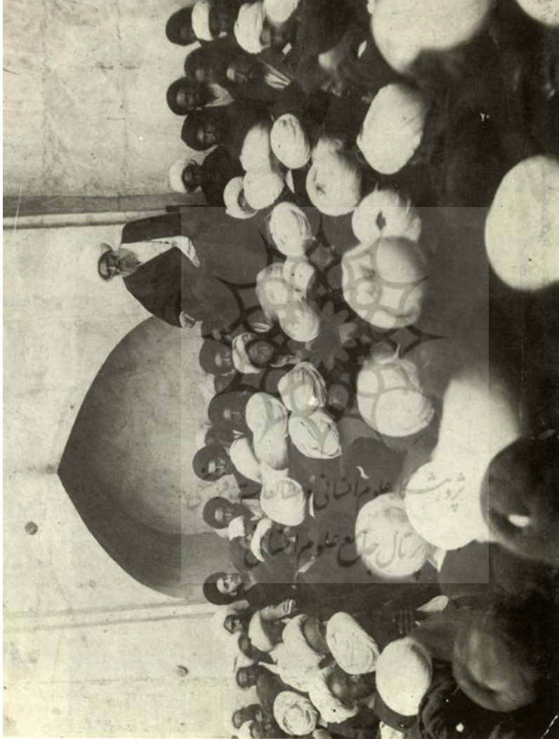
آخوند ملا محمد کاظم خراسانی در مجلس (از کتاب ایران امروز)

به کتابخانه مجلس شورای ملی اهداء شده از کتابهای مهمی است که در معارف اسلامی به رشته تحریر درآمده است.