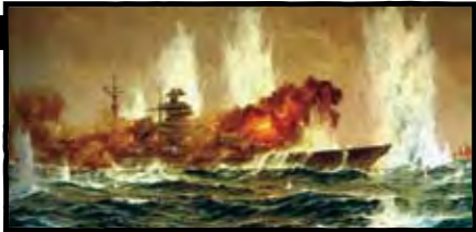
بعد از غرق شدن بیسمارک تاوی در خاطر آتش نوشت: این رزمناو نبرد شجاعانه‌ای را برابر غیرممکن‌ها انجام داد

به همه ناوهایش دستور داد دنبال حمله هماهنگ نباشند؛ گفت هر کس از هر جا که توانست به بیسمارک شلیک کند، با شنیدن این پیام، ناوها و ناوشکن‌های انگلیسی شروع به پر تاب کردن توپ‌هایشان کردند.