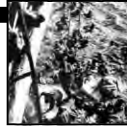
پناه آوردن به انگلیسی‌ها کاری بود که افسران یخ‌زده آلمانی مجبور شدند به آن تن دهند

سفر جیمز کامرون یادستگاه‌های مخصوص اقیانوس گردی به عمق ۴۸۵۰ متری آب‌های اقیانوس اطلس نشان داد گفته رابرت بالاک اولین کاشف بیسمارک در دست بوده: آلمانی‌ها خودشان بیسمارک را غرق کرده بودند