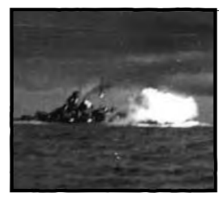
تقلای بیسمارک برای ماندن روی آب به نتیجه نرسید و غرق شد