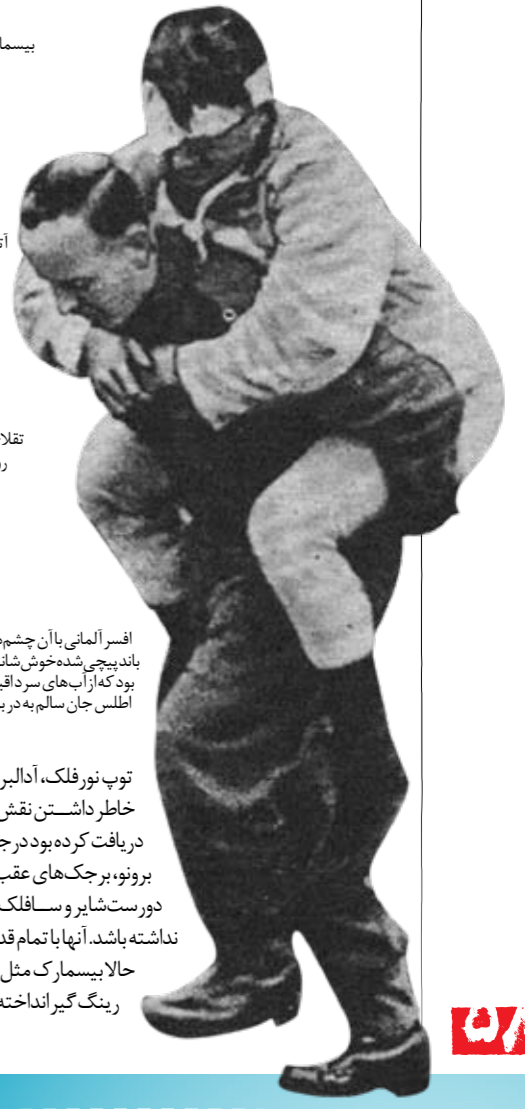
افسر آلمانی با آن چشم‌های باند پیچی شده خوش شانس بود که از آب‌های سرد اقیانوس اطلس جان سالم به در برد