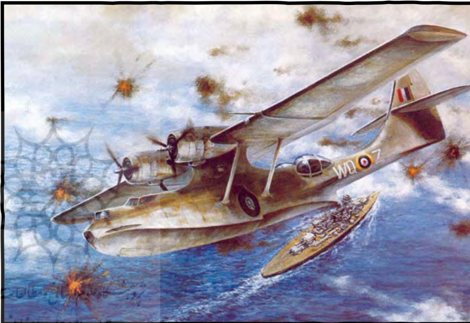
پیران جان سوم آلمانی

ساعت به حدود ۱۱ رسید. تاوی متوجه شد با وجود برتری عددی ناوگانش، نمی‌تواند در تاریکی شب حریف بیسمارک شود. برای همین