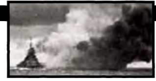
توپ‌های بیسمارک با شلیک توپ‌های دشمن از کار افتاد

غرق نشدن مشکلی دیگر برای اسرای آلمانی بود، چون نمی دانستند دشمن قرار است چه بلایی سرشان بیآورد