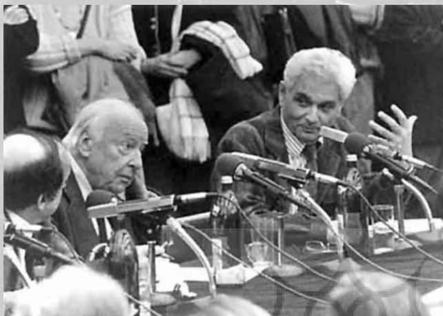
گادامر همراه با دریدا

برای مشخص ساختن موضوع فهم نابسند است. این واقعیت از دلالتی عام برخوردار است، و از این نظر زیبایی‌شناسی بخش مهمی از کل حوزه‌ی هرمنوتیک به شمار می‌آید. این مسأله‌ای است که باید بر آن تأکید کرد. هر آنچه، به گسترده‌ترین معنای کلمه، در مقام سنت با ما سخن می‌گوید،