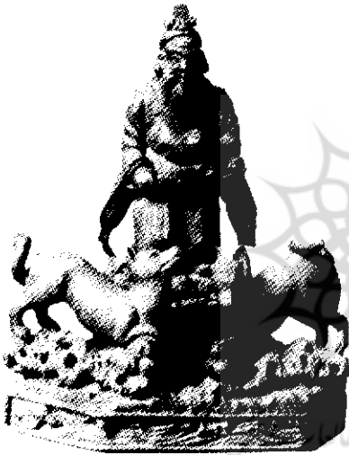
ایناری، تسندیسک چوبی، دوره توکوگارا (۱۶۰۳-۱۸۶۷)

درون و هم بیرون ایزدکده‌های وقفِ خدای برنج دیده می‌شود. ویژگی‌های دیگر ایزدکده‌های ایناری ساختمان‌های سرخ سیر، ردیف‌های طولانی توری‌یی TORII (دروازه مانندهای) نذری و هوشو-نو تاما ( hōshu-no-tama ) (یک نشان گلابی شکل که روی آن نمادهای شعله مانند قرار دارد) است.