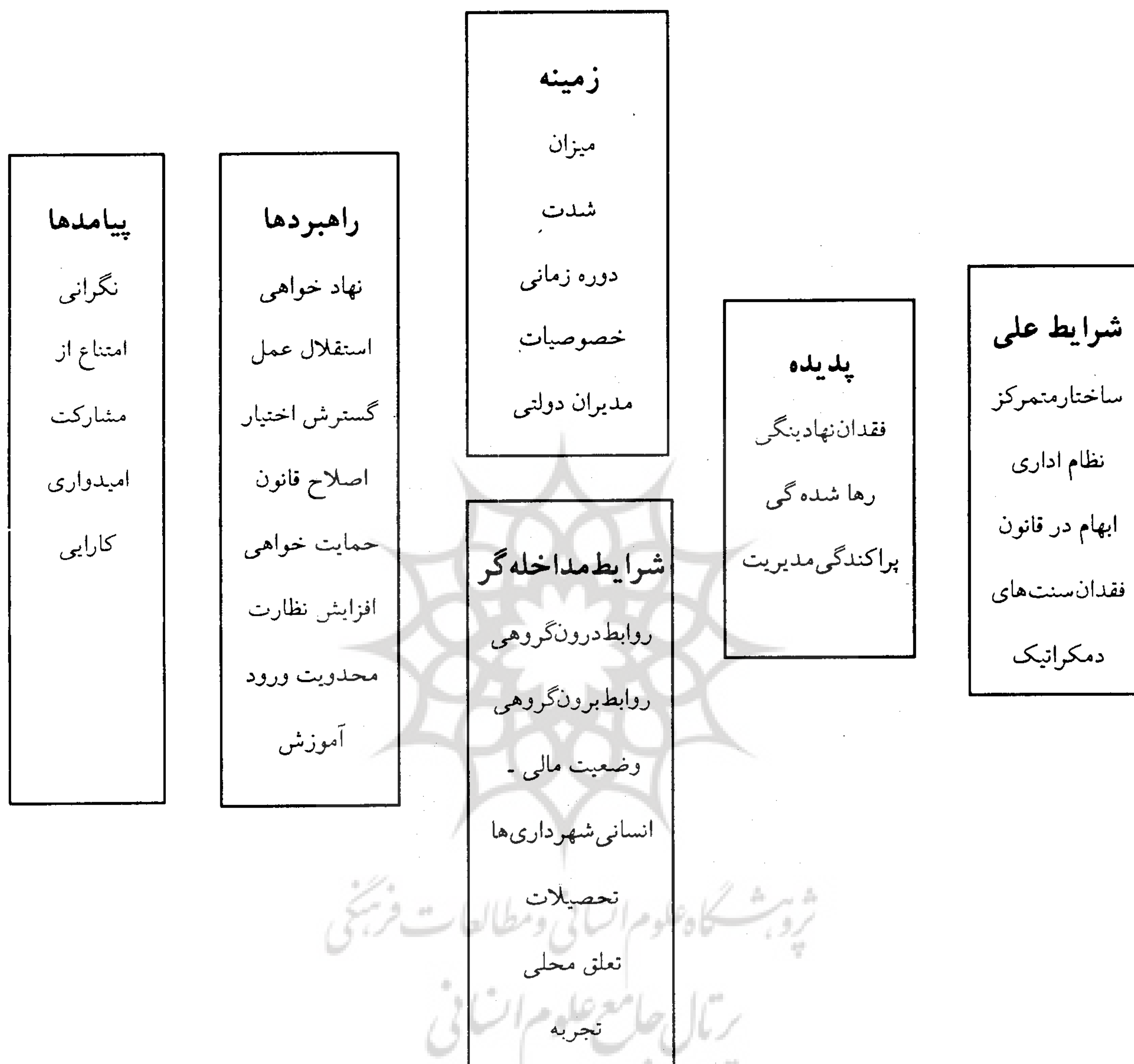
شکل ۳- مدل پارادایمی تحقیق عوامل موثر بر کارایی شورهای شهر