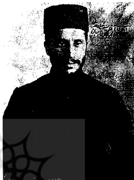
سید ضیاءالدین طباطبایی (۱۳۰۳-۱۳۶۸)

انگلیس، با حمایت از این طبقه، در افکار عمومی ایرانیان در جایگاهی قرار گرفت که قبلاً منفورترین قدرت خارجی یعنی روسیه قرار داشت. او به دستگاه دیپلماسی بریتانیا توصیه می‌کند که باید از الیگارشی حاکم بر ایران فاصله بگیرد؛ زیرا با این کار به مستبدترین عناصر کشور پیوند خورده و اعتماد دیگر دوستان و متحدان طبیعی انگلیس در ایران از دست می‌رود. ۱۳ نتیجه مستقیم این رویکرد، روکار آوردن مدیریت بیرون از هیئت حاکمه و الیگارشی موجود، با طرح و شعاری نوین بود. آنان، با توجه به بیش از صد