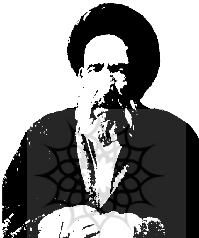
پژوهشگاه علوم انسانی و مطالعات فرهنگی آیت‌الله سید حسن مدرس | ۱۲۷۹-۱۲۸۷م

مدیریت و نداشتن برنامه‌های کاربردی برای اداره کشور، از انقلاب مشروطیت تا کودتای ۱۲۹۹، ۵۱ بار هیئت دولت تغییر کرد. مداخله روس و انگلیس در امور کشور، که از آغاز سلطنت قاجاریه شروع شده بود، همواره روزافزون بود و به ویژه در دوران جنگ جهانی اول به اشغال کشور و حضور نظامی آنان انجامید و بی‌ثباتی سیاسی و نابسامانی اقتصادی را شدت بخشید. به بیان دیگر، جامعه ایران ثمره آزادی‌ای را که مشروطه‌خواهان سکولار ادعای آن را داشتند، دید و اکنون خواهان نظم و امنیت و پیشرفت کشور بود. اما طبیعی است که این را از رجال اصیل خود می‌خواست و نه از دولتهای بیگانه. در چنین فضایی، نخبگان سیاسی کشور به شیوه‌های گوناگون به این