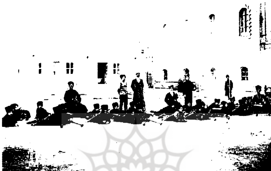
سرهنگ فیلاتوف روسی فرمانده آتریاد (تیپ) تهران و سرهنگ رضاخان در حال آموزش تیراندازی به نیروهای قزاق (۱۹۰۱-۱۹۰۲ع)