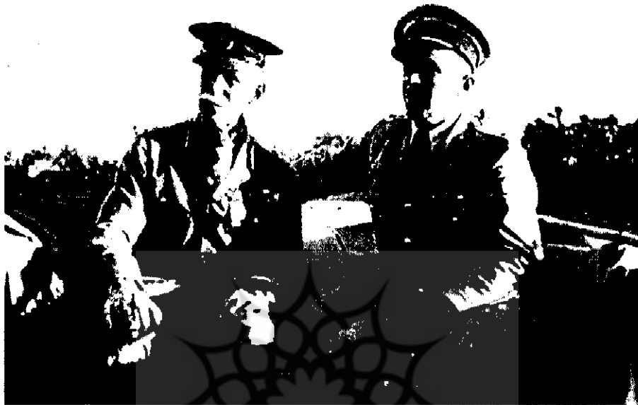
ژنرال آیرنساید و ژنرال هالدین بعد از کودتای ۱۲۹۹ | ۱۹۴۲-ع |

سرکوب دهد و ایجاد دولت ثابت و نیمه دیکتاتوری بنماید، مذاکره کرد و من با او در لزوم چنین دولتی به طور کلی موافق بودم؛ ولی در انتخاب افراد و اعضاء آن دولت سلیقه ما را استنبامد و هر اشکالی که من داشتم در این مسئله بود و قرار شد باز هم فکر و صحبت کنیم ولی بعد معلوم شد که فرصت فوت می شده است و وقت مذاکره طولانی نبوده است. ۴۸