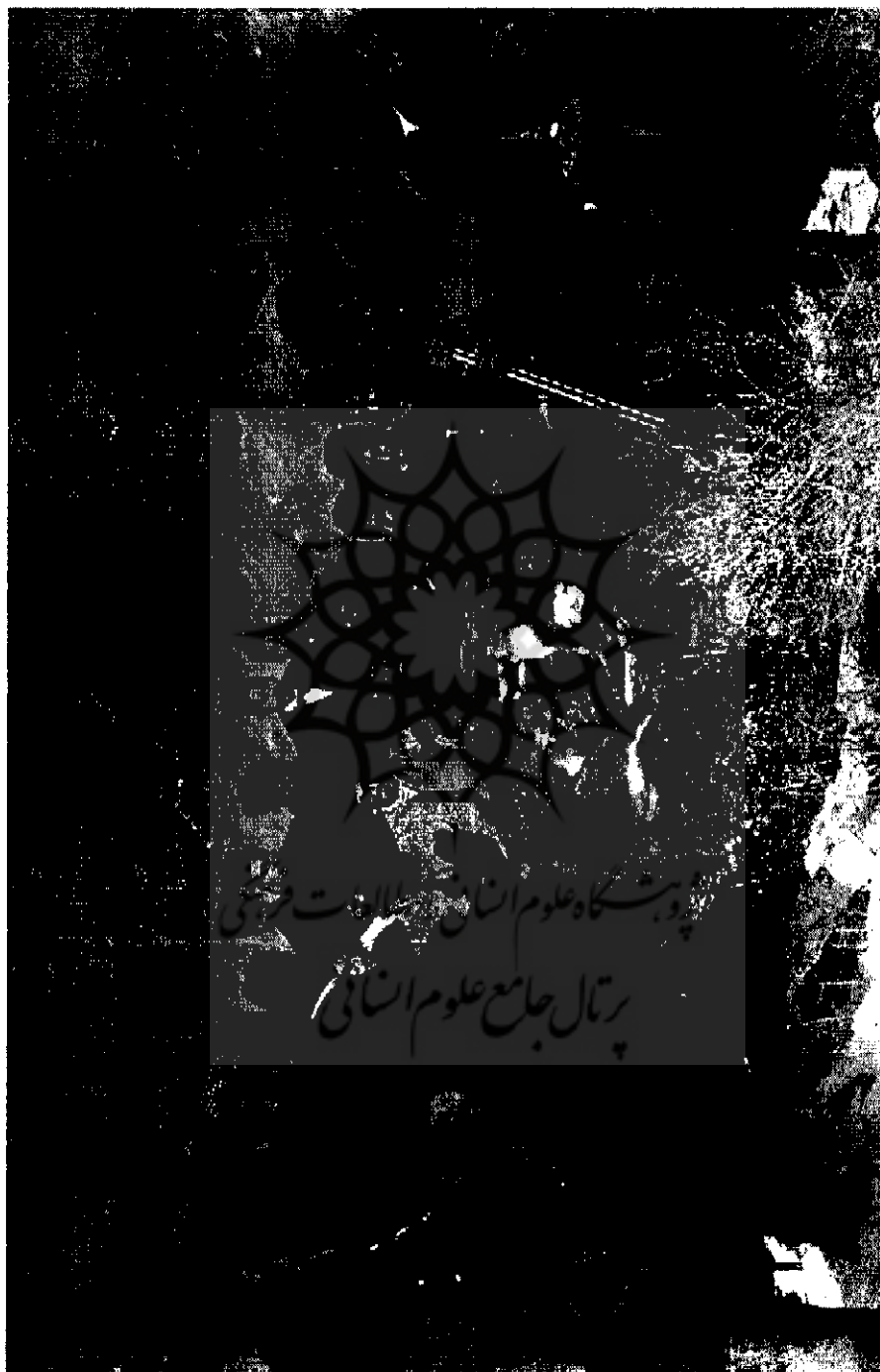
مظفر الدین شاه و علی اصغر خان اتابک و عده‌ای از درباریان در شکارگاه | ۲۲۸۱-ع