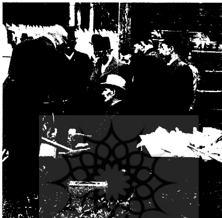
مظفرالدین شاه در اروپا | ۲۸۹-۴۰۴ |

وانگهی، نحوه برقراری ارتباط با همکار من (دکتر ژرژ)، که به لحاظ درجه و مقام شغل و نظامی پایین تر است، کاملاً نادرست و خارج از شئون یک دیپلمات می باشد؛ زیرا بدین ترتیب شما او را تشویق می کنید که به روابط دوستانه و اعتمادی که بین ما وجود دارد پشت پا بزند. چنانچه کنت دپشیه واقعاً دچار نگرانی و اضطراب مین پرستانه شده بود، که به نظرم وی در نشان دادن چنین احساساتی اغراق می کند، به گمانم بهتر بود با خود من این مسئله را در میان می گذاشت و تا با کمک همدیگر راه حل مناسبی پیدا می کردیم.