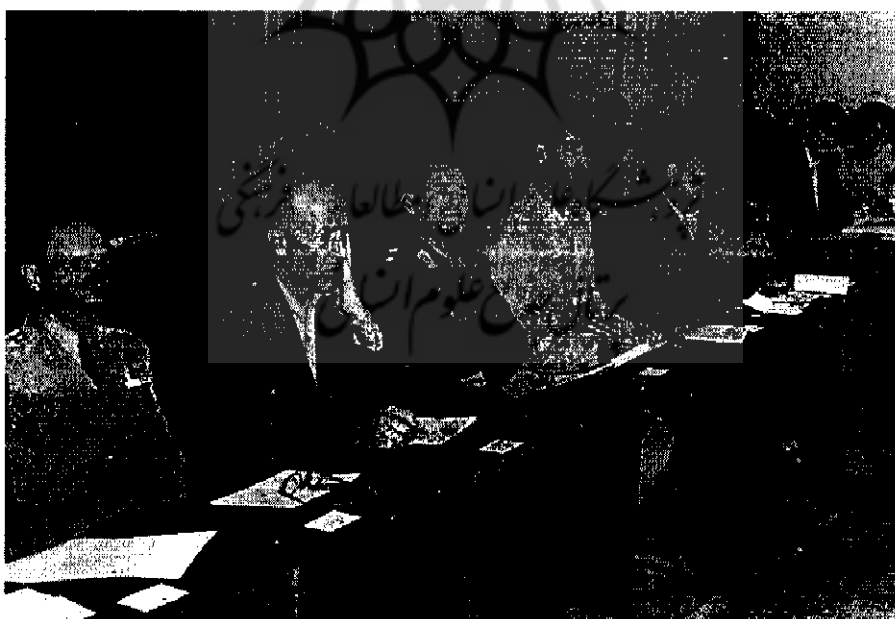
محاكمه تعدادی از افسران شاخه نظامی حزب توده | ۴-۷۸۷۸