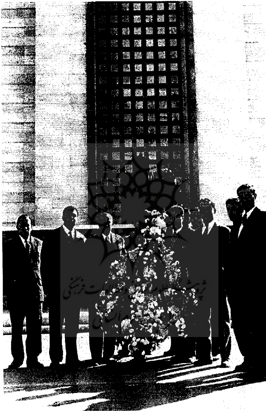
جمعی از افسران نادم حزب توده در حال نثار تاج گل بر آرامگاه رضاشاه | ۸۲۳-۱۴