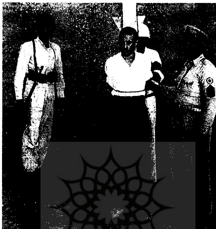
مهنای وظیفه گهربار عضو سازمان نظامی حزب توده چند لحظه قبل از تیرباران | ۴-۳۲۶۹