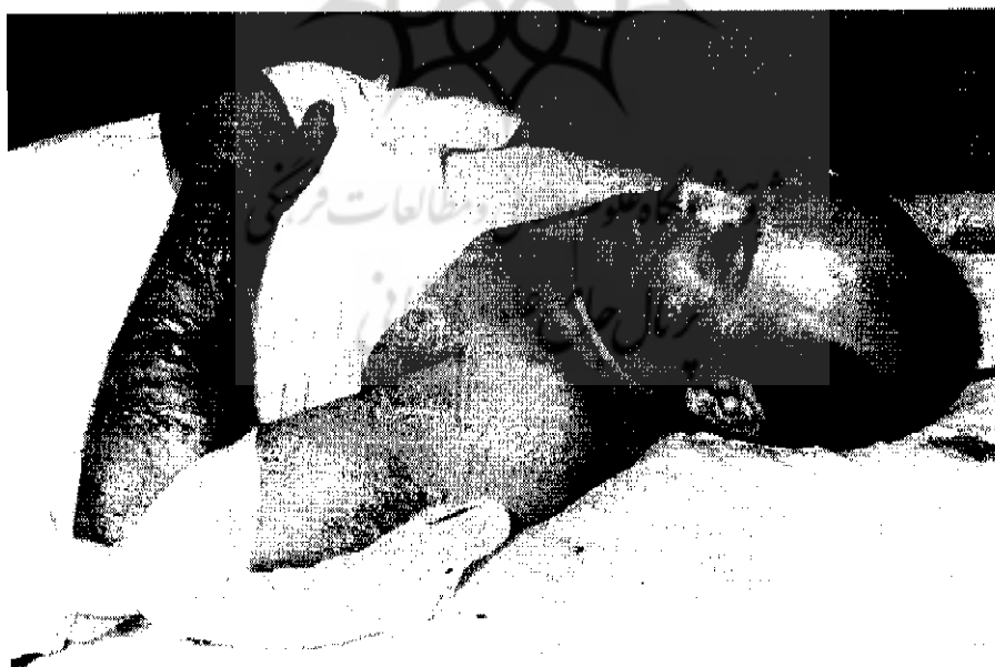
خسرو روزبه از سران شاخه نظامی حزب توده، هنگام بستری شدن در بیمارستان | ۴-۳۲۵۴