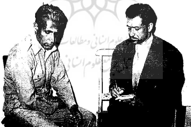
سرهنگ فتح‌الله پهلوان عضو شاخه نظامی حزب توده در یک مصاحبه مطبوعاتی | ۴-۸۴۴