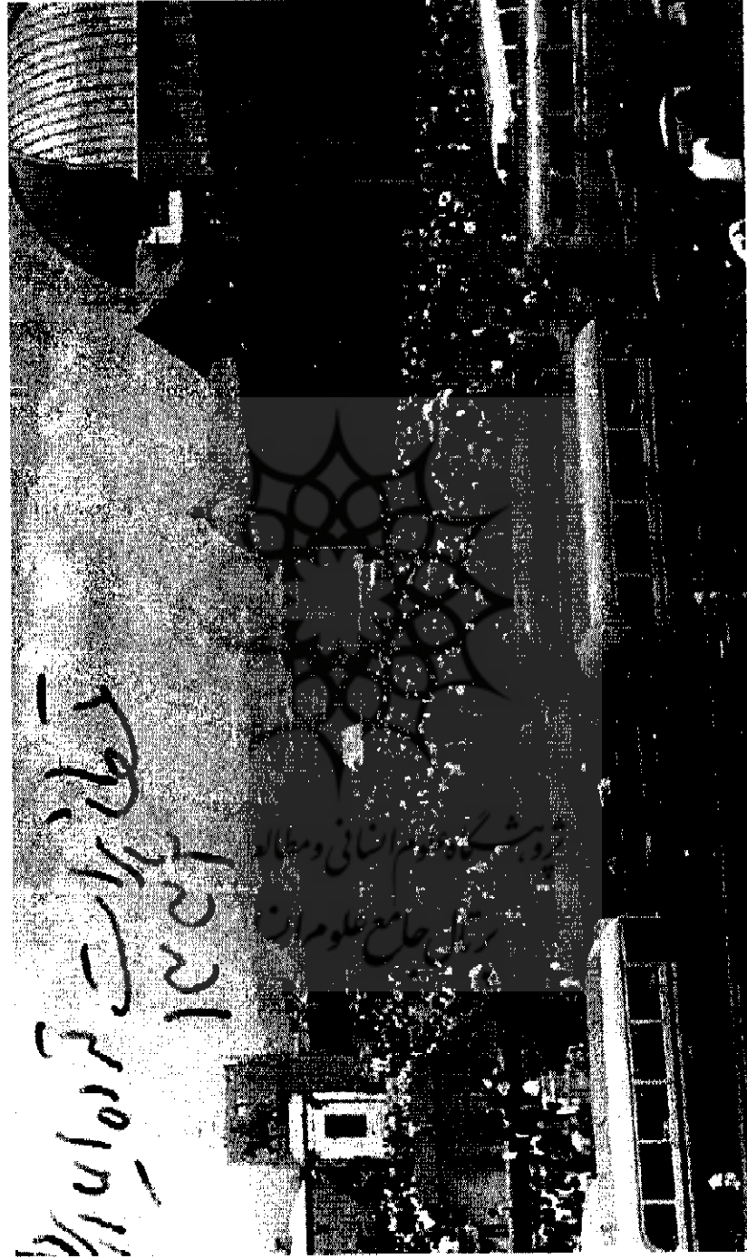
یکی از آخرین تظاهرات اعضای حزب توده در میدان توپخانه تهران (مرداد ۱۳۳۲) | ۴۷۱۳-۴۷۸۸م