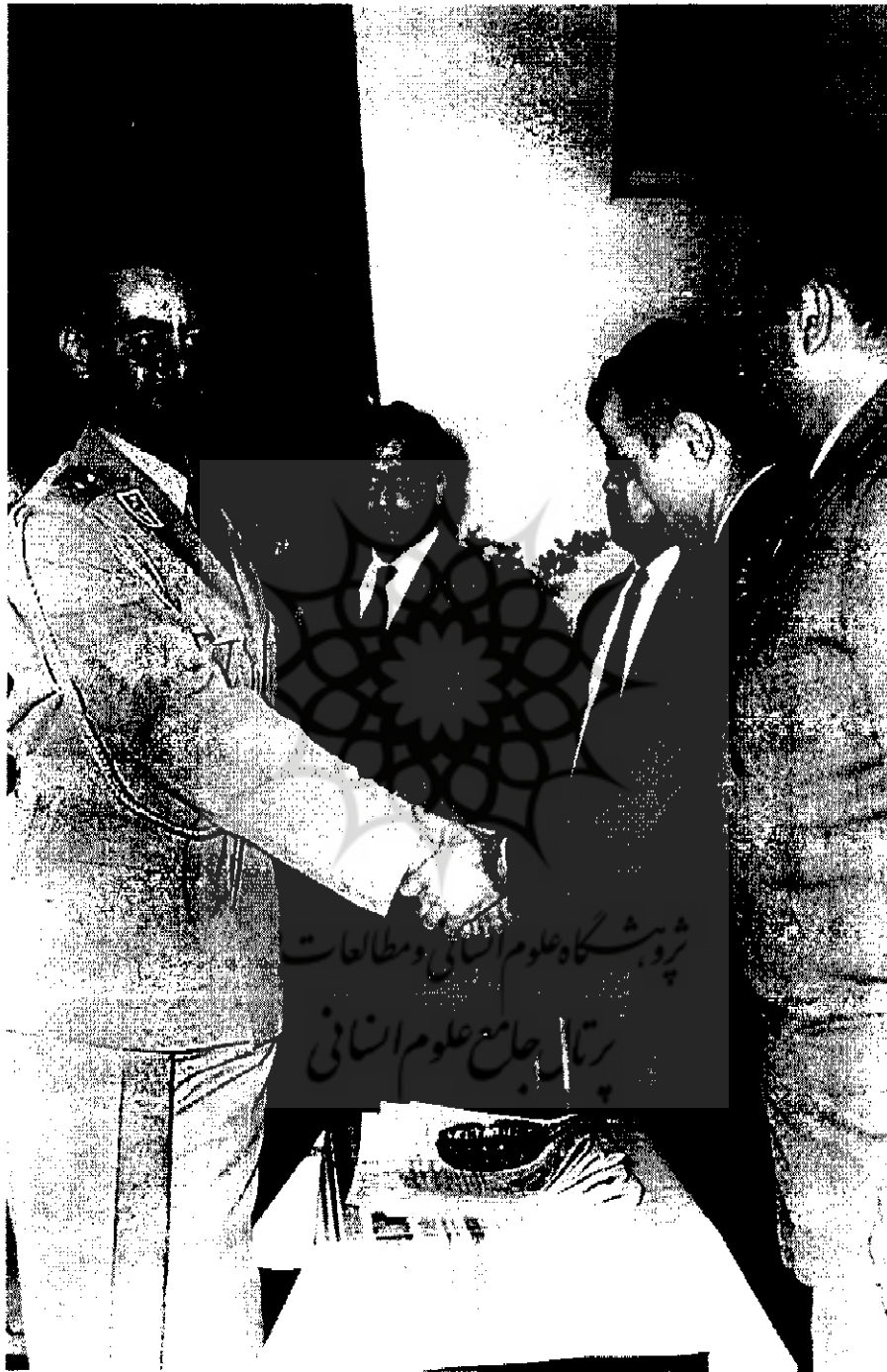
تیمور یختیار رئیس حکومت نظامی به هنگام ملاقات با چند تن از افسران نادم حزب توده | ۸۲۲-۴ |