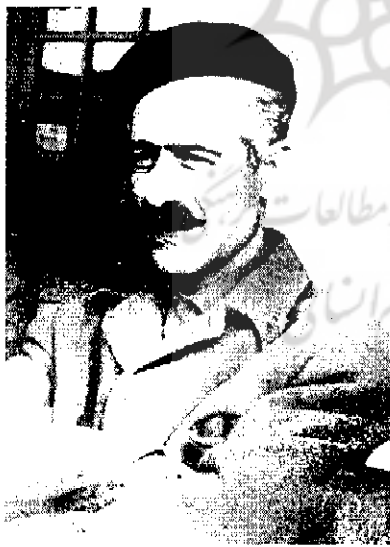
جلال آل‌احمد | ۱۲۸۷-۴۰م

نسبوندند، تعداد انگشت‌شماری از دانشجویان مانند من عضو حزب ایران یا احزاب ملی دیگر مثل پان‌ایرانیستها بودند. تا جایی که من اطلاع دارم به غیر از دانشجویان توده‌ای، تشکیلات دانشجویی در قالب سازمان در فاصله ۱۳۲۶ تا بهمن ۱۳۲۸ وجود نداشت و هر گروهی با توجه به گرایش فکری - سیاسی خود فعالیت می‌کرد. تعداد دانشجویان وابسته به حزب توده نسبت به دانشجویان ملی مذهبی بیشتر و فعالیشان چشمگیرتر بود اما اکثریت