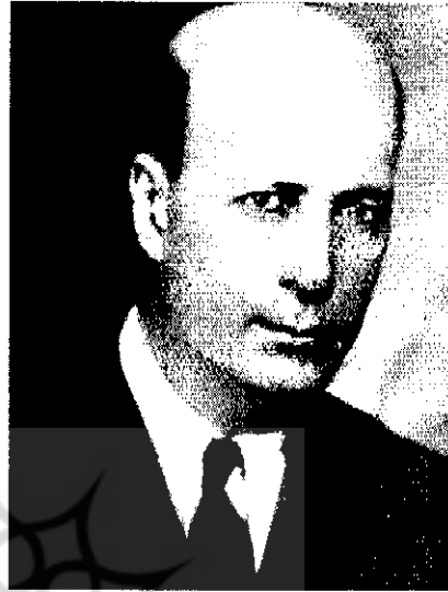
خلیل ملکی | ۱۹۰۲-۱۹۴۰ع

همین جهت عده‌ای از روشنفکران غیروابسته که از مسائل پشت پرده حزب اطلاع پیدا کردند به رهبری خلیل ملکی از حزب منشعب شدند. من چون از خطه شمال بودم خیلی زودتر می‌توانستم ارتباطات میان حزب را با دولت شوروی حس کنم ولی این موضوع هنوز در سیاست علنی و بارز نشده بود. زمانی که توده‌ایها زیر اسلحه سربازان شوروی تظاهرات کردند و مرحوم جلال آل‌احمد در خاطراتش به خوبی آنرا عنوان کرده تعدادی از اعضای حزب که مخالف هر نوع وابستگی حزب به شوروی بودند شروع به مخالفت کرده و از حزب بیرون آمدند. در محیط دانشگاه زمانی که من وارد شدم تعدادی از دانشجویان وابسته به حزب بودند اما غالب