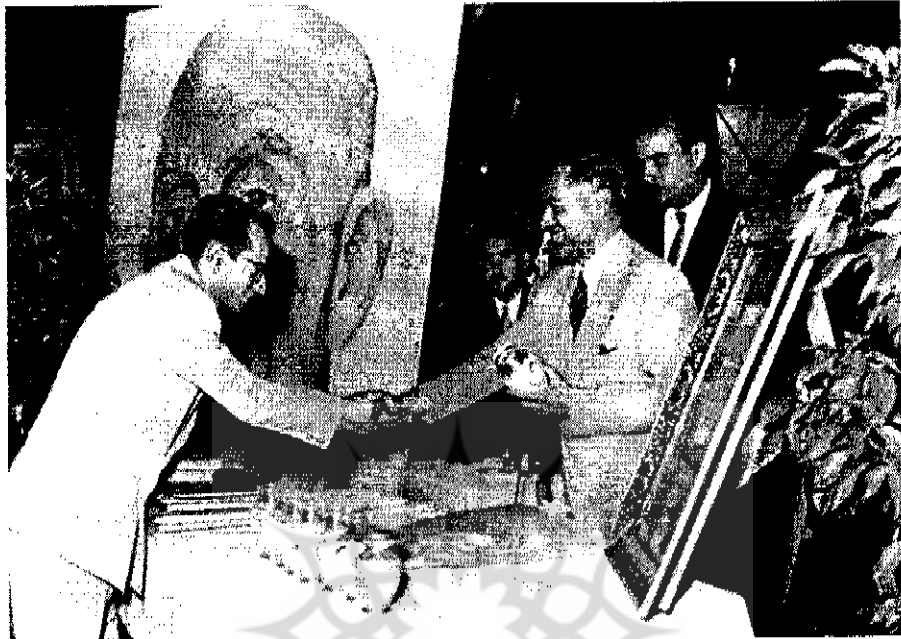
مهندس احمد زیرک‌زاده هنگام توزیع جوایز به نفرت برتر یک مسابقه | ۱۳۲۲-۱۳۲۴ط