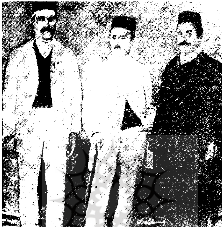
مثنی‌زاده با کمک ابوالفتح‌زاده و مشکوة‌الممالک شالوده کمیته مجازات را ریختند

کرمانی و آقاسید قریشی (از اعضای بیت سید محمد طباطبایی) ۱۰۳ و شیخ مهدی ۱۰۴ (پسر آیت‌الله شیخ فضل‌الله نوری) عضویت داشتند. در همین زمان گرایشهای تروریستی برخی از اعضای این انجمن کاملاً مشهود بود. برای مثال، در یکی از جلسات انجمن مسئله قتل آیت‌الله سید عبدالله بهبهانی مطرح شد که با مخالفت سیدمحمد صادق طباطبایی مواجه گردید. ۱۰۵ اندکی بعد، ارباب جمشید جمشیدیان (دوست صمیمی و محرم اردشیر ریپورتر) به عضویت این انجمن درآمد. ۱۰۶ گروه تروریستی فوق، سرانجام، شکل نهایی خود را یافت و به عملیات آشوبگرانه و تفرقه‌افکنانه‌ای چون ترور نافرجام شیخ‌فضل‌الله نوری (۱۶ ذیحجه ۱۳۲۶ق.) دست زد.