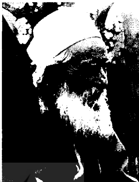
عباس افندی (عبدالبهاء) [۱۲۹۷-۱۳۰۸ع] شوقی افندی ربانی نوه دختری عباس افندی و آخرین پیشوای بهائیان [۱۳۴۶-۱۳۰۸ع]

پس از پایان جنگ اول جهانی، شورای عالی متفقین قیومیت فلسطین را به دولت بریتانیا واگذار کرد و در ۳۰ ژوئن ۱۹۲۰ سر هربرت ساموئل به عنوان نخستین کمیسر عالی فلسطین در این سرزمین مستقر شد. ساموئل از اندیشمندان و فعالان برجسته و نامدار صهیونیسم بود و به خانواده معروف ساموئل - مونتگ تعلق داشت. در دوران پنجساله حکومت مقتدرانه «شاه ساموئل» ۲۵ در فلسطین دوستی و همکاری نزدیکی میان او و عباس افندی وجود داشت؛ و در اوایل حکومت ساموئل در فلسطین بود که دربار بریتانیا عنوان «شهباز طریقت امپراتوری بریتانیا» ۲۶ را به عباس افندی اعطا کرد. ۲۷ اعطای این نشان به پاس قدردانی از خدمات بهائیان در دوران جنگ بود.