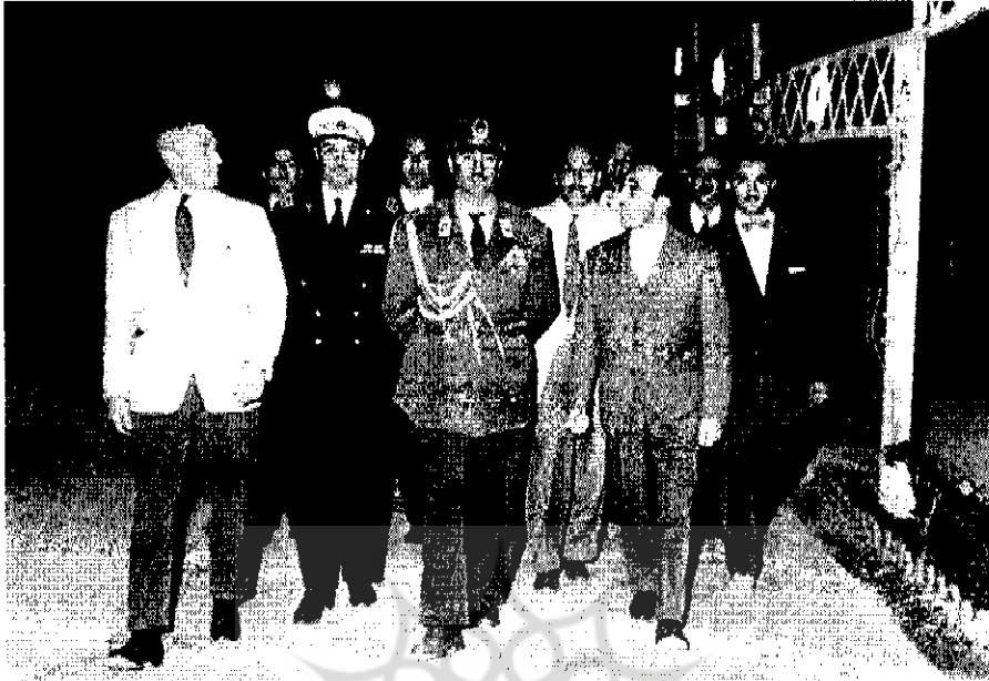
تیمور بختیار رئیس سازمان امنیت در بازدید از استان فارس | ۶۲ ۱۳۱۴ |

ایشان از اردیبهشت / رمضان ۱۳۳۴ ش. اعتراض شدید آیت‌الله‌العظمی بروجردی ۴ و سایر علما را برانگیخت. پس از ابراز ناراضی‌های شدید آیت‌الله بروجردی، حکومت پهلوی ناگزیر به محدود کردن فعالیت بهائیان شد. به دستور شاه پزشک مخصوص بهائی او، سرلشکر عبدالکریم ایادی، مدت کوتاهی ایران را ترک کرد و در ایتالیا اقامت گزید ۵ و در ۱۶ اردیبهشت مقامات نظامی (سررتیب تیمور بختیار فرماندار نظامی تهران و سرلشکر نادر باتمانقلیچ رئیس ستاد ارتش) به تصرف و تخریب حظیرةالقدس، مرکز بهائیان تهران، یاری رسانیدند. بختیار این محل را مقر رکن دوم ستاد ارتش ساخت دکتر مهدی حائری یزدی علت مقابله شدید آیت‌الله بروجردی با بهائیان را چنین ذکر می‌کند: در مسئله بهائیه، تا آنجایی که ایشان تشخیص می‌داد، این بود که بهائیه یک گروه