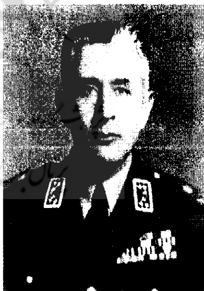
سرلشکر عبدالکریم ابادی | ۲۴۴۳-۱۱ع