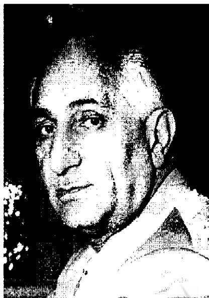
حبیب ثابت مؤسس تلویزیون ایران | ۳۲۶۴-۴۴ع