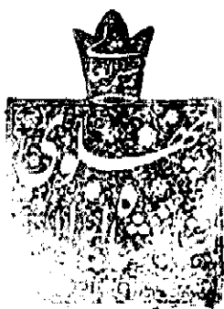
بسمه تعالی پهلوی شاهنشاه ایران ۱۳۰۴

دستی شاه استفاده می‌شد. شکل آن مهر، چهارگوش کلاهک‌دار و به سجع (شکل ۱) بوده است. ۳۹