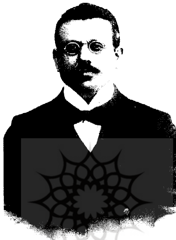
اردشیر جی، از عوامل اصلی انگلستان در کودتای سوم اسفند ۱۲۹۹ | ۳۸۹-۱۱