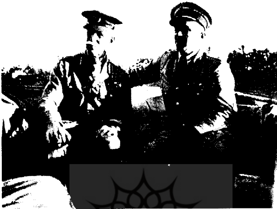
ژنرال آبرون‌ساید و ژنرال هالدین در درون قایق رود دجله در بندها بعد از کودتای ۱۲۹۹ | ۱۹۴۲-۱