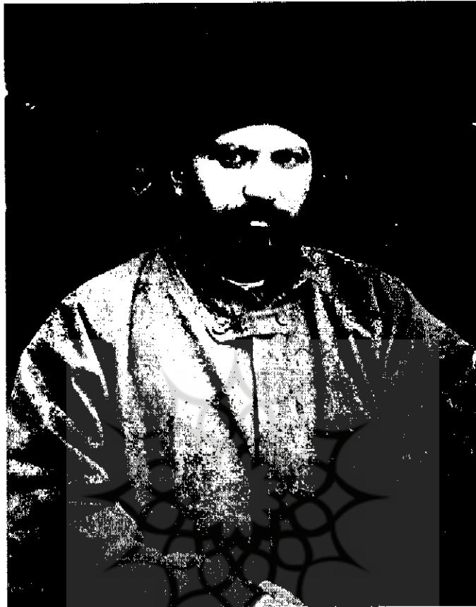
سید جمال‌الدین اسدآبادی | ۲۲۱۷-۱۴

یک از این قیام‌ها رهبری مدیر و کاردانی دید نشد. مهم‌ترین این شورش‌ها قیام مهدی سودانی بود. اعتقاد به مهدویت در میان مسلمانان جایگاه برجسته‌ای دارد. معهذ، حتی قیام سودان نیز که با تکیه بر این باور دینی عمیق بود به جایی نرسید. پس از شکست و افول این جنبش‌ها، بار دیگر به‌طور موقت سکوت دنیای اسلام را فراگرفت و این سرآغاز مرحله نوینی در تجدید حیات دنیای اسلام است. در این مرحله، متفکرین مسلمان درک کردند که در برابر سپاه مقتدر و منظم و اسلحه پیشرفته اروپایی جنبش گروهی از مردم تهیدست و فاقد امکانات و رهبری به جایی نمی‌رسد. اگر قرار است دنیای اسلام را از یوغ اسارت اروپا رها سازند، باید به دانش و آگاهی جدید مجهز شوند و از غرب راز تفوق و برتری آن را بیاموزند و برای تحقق این آرمان به یک نوزایی دینی نیاز است. بدینسان، جنبش اتحاد اسلام، به شکل آگاهانه آن، از اواسط سده نوزدهم