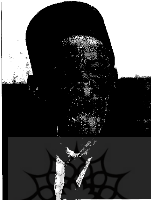
مخبر السلطه هدايت | ۲۵۰۸-۱پ

سایر نمایندگان داشتند موضعگیری ایشان در این باره جدی تر می نمود. پیشنهاد داده شد تا اوراق قرضه ملی در اختیار افراد کشور قرار گیرد تا با سپردن سرمایه‌هایشان به بانک پایه‌های مالی آن را تحکیم بخشند و حتی در گوشه و کنار کشور نیز از این طرح پیشنهادی نمایندگان مجلس استقبال به عمل آمد تا جایی که «چند نفر نیز لایحه‌ای به مجلس فرستادند که بانک ملی تشکیل بدهید؛ ما چند نفر گمنام یکصد هزار تومان فعلاً موجود کرده‌ایم». ۳