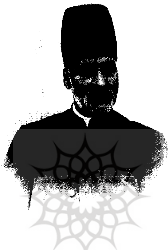
میرزا نصرالله‌خان مشیرالدوله نائینی صدراعظم مظفرالدین‌شاه و محمدعلی‌شاه | ۱۱-۲۹۰۲

انگلیس، به ویژه با شرایط دشواری که در آن پیش بینی شده بود، مردود دانست، و پیشنهاد کرد که جهت به دست آوردن چهار کرور تومان ضروری و مورد نیاز بهتر است به منابعی غیر از کشورهای خارجی متوسل بشوند.