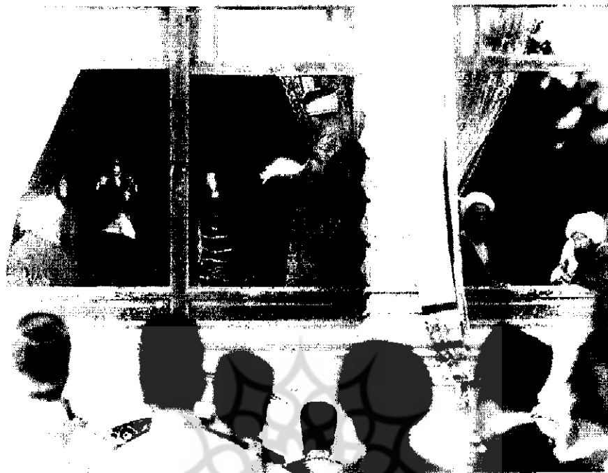
مظفردین شاه به هنگام گشایش اولین دوره مجلس شورای ملی ( ۱-۲۴۶۷ )

تومان (هر کرور ۵۰۰ هزار تومان) بدهی داخلی و خارجی داشت. به همین دلیل مذاکراتی بین هیئت دولت ایران و نمایندگان کشورهای روس و انگلیس صورت گرفته بود تا آنها جهت پرداخت بدهیهای دولت مشترکاً یک وام در اختیار ایران قرار دهند. دو دولت پیشنهاد کرده بودند در صورت تصویب مجلس از طریق حواله دادن مبلغ مورد درخواست دولت به دو بانک شاهنشاهی و استقراضی این پول در اختیار دولت ایران قرار گیرد. روس و انگلیس مشترکاً قبول کرده بودند که این وام را از قرار بهره ۷٪ به دولت ایران بپردازند. با این حال، شروط دیگری را نیز در این باره با دولت ایران در میان گذاشته بودند. اولین شرط آنان این بود که حکومت ایران موظف است مبالغ وام داده شده را با اطلاع و نظر دو دولت روس و انگلیس به مصرف برساند. نظر به اینکه پیش از این هم دولت روسیه مبالغ هنگفتی از دولت ایران طلبکار بود دریند دوم قرار نهاده شد که این کشور از وجه جدیدی که در اختیار دولت ایران قرار خواهند داد هیچگونه وجهی جهت تأدیه وام پیشین مطالبه نکند. براساس مذاکرات هیئت دولت با دولتهای روس و انگلیس در مرحله اول چهارکرور تومان در اختیار دولت ایران قرار می‌گرفت و مدت بازپرداخت آن هم یک سال تعیین شده بود. برطبق شرط پنجم وثیقه بازپرداخت این وام