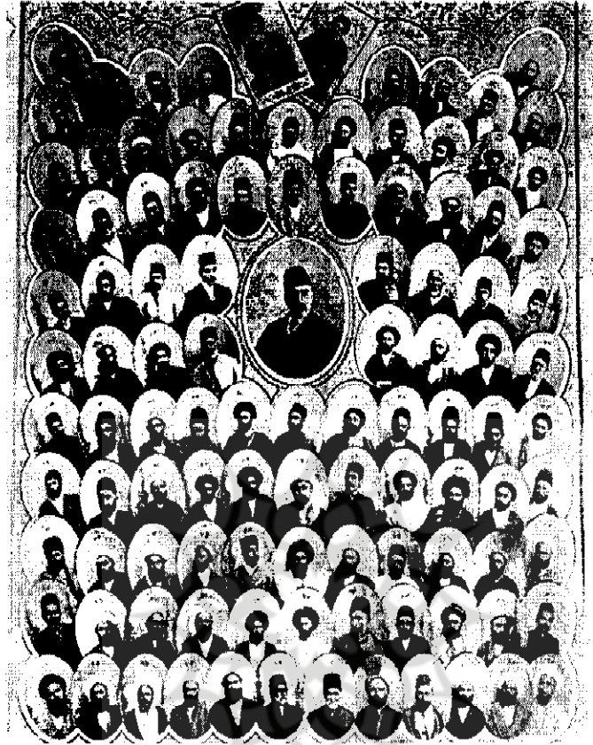
نمایندگان مجلس شورای ملی ایران در دوره اول [ ۱۱-۴۶۴۵ ]

نهاده شد که هریک از نمایندگان که نمی‌توانند همدلی لازم را با امور اصلاحی مجلس، که شاخص‌ترین آنها در آن برهه تأسیس بانک ملی بود، نشان دهند «برای آنها بهتر این است که استعفا دهند». و همچنین جهت جلوگیری از حیف و میل سرمایه‌های واگذاری به دولت و سایر افراد حقیقی و حقوقی قرار بر این نهاد شد که خود اجزای مؤسسان و کارگزاران بانک بر ورود و خروج پول از بانک و هزینه کردن در حد امکان آن نظارت داشته باشند. ۱۶