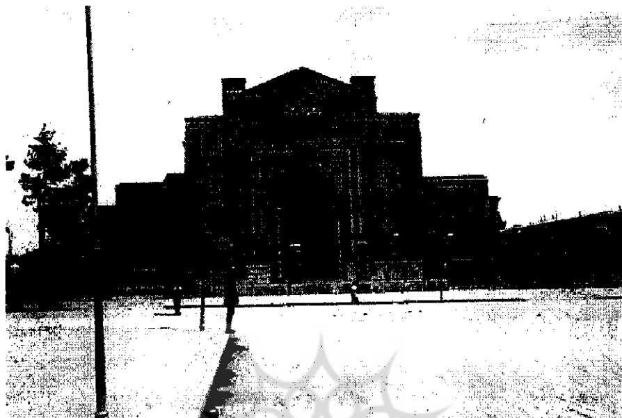
نمایی از بانک شاهنشاهی ایران واقع در میدان توپخانه تهران | ۱۱-۲۷۱۷

تفکر را به شاه القا می‌کرد که بانک ملی جدید التأسیس قادر نخواهد شد پول مورد درخواست آنها را پردازد و شاید تا حدودی شاه را از عواقب تصمیم‌گیریهای مجلس درباره محدودیت قرار دادن در مورد مسائل مالی دولت و شخص وی او را می‌ترسانید. در غیر این صورت در موقعیتی که دولت نیاز مبرمی به پول نقد داشت تعلل در امضای قرارنامه قرض از بانک ملی که به تصویب مجلس هم رسیده بود، امری عبث و بیهوده می‌نمود مگر آنکه این عمل دولتیان صرفاً به سوءنیت آنها تعبیر شود. نمایندگان مجلس نیز همین عقیده را داشتند که هیئت دولت و دربار «گویا میل هم نداشته باشند که این بانک ملی تأسیس شود و به عرض شاه می‌رسانند که بانک ملی نمی‌تواند پول بدهد» زیرا شنیده شده بود که «دو هفته قبل مجلسی در دربار منعقد شده در باب استقراض از بانک ملی یا از خارجه، پس از مذاکره گویا قرض از خارجه را تصویب کرده‌اند.» نمایندگان حق داشتند انتقاد کنند که «بعد از آنکه خود بانک ملی حاضر است در دادن پول دیگر این مذاکرات برای چیست؟...»