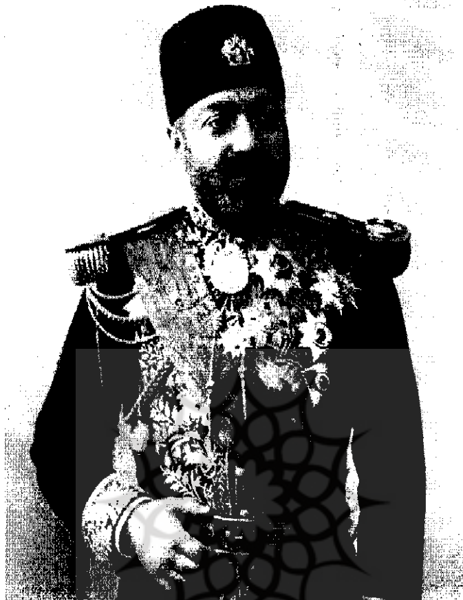
ابوالقاسم ناصرالملک | ۱۱۲۳-۱۱

همراه با صورت عایدات و مخارج دولت به مجلس ارائه دهد تا خود مجلس در این باره تصمیم بگیرد. در همین زمان، گفت‌وگو درباره طرح ایجاد بانک ملی در میان نمایندگان مجلس ادامه داشت و نمایندگان طبقه تجار راهکارهای عملی آن را مورد بحث و بررسی قرار می‌دادند. از سوی دیگر گروه‌های دیگر مجلسیان نیز جهت تحقق یافتن رؤیای تأسیس بانک با تشکیل اجتماعات مختلف در فکر تهیه سرمایه اولیه بانک بودند. بیشترین جلسات در مدرسه سه‌سالار تشکیل می‌شد. چنانچه از گزارش‌های آن دوره برمی‌آید در روز افتتاح این جلسات «از همان مجلس پنجهزار تومان جمع گردید.» ۵ از