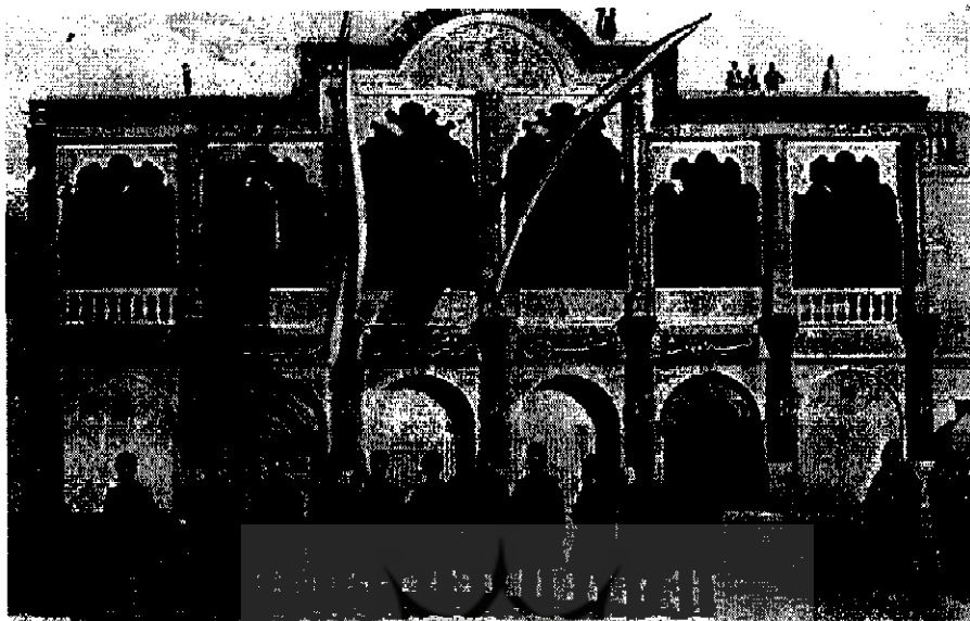
اجتماع جمعی از فراشان و خادمان دربار در مقابل ساختمان بانک شاهی به مناسبت سالروز تولد مظفرالدین شاه | ۱۱-۴۶۲۷

با این که پس از تصویب مجلس شورای ملی برگه‌های سهام نیز منتشر شد، اما عملاً به‌رغم قولهای مساعد جمیع نمایندگان و اقشار دیگر مردم، استقبال چندانی از مشارکت در سرمایه‌گذاری برای بانک ملی به عمل نیامد. سعدالدوله گزارش داد که اگرچه چندین روز از انتشار برگه‌های سهام می‌گذرد با این حال تعداد مشارکان از تعداد انگشتان دست تجاوز نمی‌کند. وی نمایندگان مجلس را به باد انتقاد گرفت که در این راه همدلی کمتری از خود نشان می‌دهند و از این که نمایندگان در تشویق اطرافیان و دیگر افراد تحت نفوذ خود برای سرمایه‌گذاری در بانک کمتر رغبت نشان می‌دهند سخنان عتاب‌آلودی ایراد کرد. برخی از نمایندگان عنوان کردند که مردم هنوز اطمینان لازم را برای سرمایه‌گذاری در بانک به دست نیاورده‌اند و باید ترتیبی داده شود تا مردم از اقشار مختلف بدون واهمه در این امر مشارکت کنند. سعدالدوله به ویژه از این که مردم به‌رغم قول و قرارهای چندی قبل خود از مشارکت و سرمایه‌گذاری بانک طفره می‌روند و به اصطلاح تضمین می‌خواهند بسیار ابراز تعجب کرد و گفت «کدام اطمینان بهتر و بالاتر از این است که خود اشخاصی که برای تحویل‌داری تعیین شده و قیمت بلیط نزد آنها جمع می‌شود هر یک در این بانک مبلغ گزاف شرکت دارند و صاحب تمول و ثروت کافی هستند.»