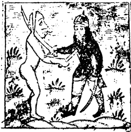
ق و چاپ سنگی، تصویری از سناس را به صورت نیمی از