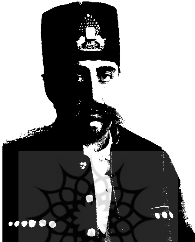
مظفرالدین شاه قاجار فرمان تشکیل مدرسه سیاسی را صادر کرد

از آن روز که خداوند معبود و کردگار حی محمود، جل جلاله و عظمت نواله، مرزبانی مملکت قدیم ایران و جانشین سلاطین با افتخار کیان را به وجود مسعود همایون مخصوص و منصوص فرمود، اهم مقاصد و اعظم مآرب خود را ترقی دولت و آبادانی مملکت و تکثیر ثروت و تنظیم امور حوزه سلطنت قرار داده مجاهدات کافیه و مراقبات وافیه در بروز این همم عالیه فرمودیم. لیکن تحصیل نتایج این افکار مقدس به وجه اکمل و احسن این طور اقتضای نمود که به مدد فیض روح القدس کالبد آن بی روح راروان بخشیم و سنجش انسانیت یعنی علم را در مملکت شایع داریم و ظلمت جهل را به نور آن بر طرف فرمائیم؛ دفع بطالت از اهالی نموده راه ثروت به آنها بنمائیم. کلید گنجهای مخفیة زمین را به دستشان داده سعادت هر دو جهان را برایشان موجود سازیم. به این جهت اشارات ملوکانه ما به ایجاد مدارس و اعتلای معارف شرف صدور یافت. لله الحمد به حسن اهتمام جنان مستطاب اجل اشرف اکرم افخم میرزا علی اصغر خان