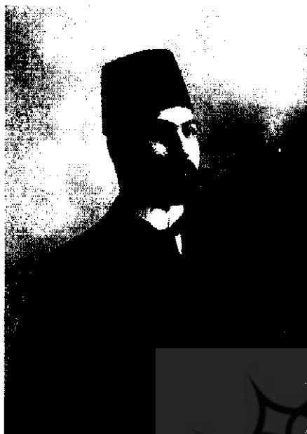
میرزا احسن خان مشیرالملک (بعدها مشیرالدوله)