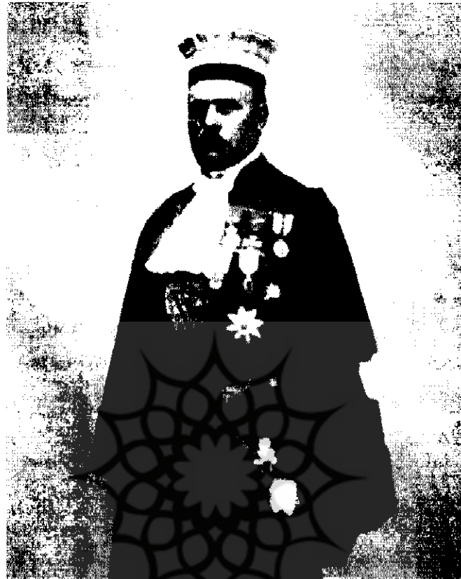
آدلف پرنی فرانسوی، اولین رئیس مدرسه عالی حقوق

تصویب‌نامه هیئت وزیران مدرسه حقوق از وزارت عدلیه و مدرسه علوم سیاسی از وزارت امور خارجه منفک، ضمیمه وزارت معارف شدند و پس از ادغام در یکدیگر تشکیل مدرسه عالی حقوق و علوم سیاسی را دادند. شرط ورود به این مدرسه داشتن دیپلم کامل متوسطه و دوره آن سه سال تعیین شد. به فارغ‌التحصیلان درجه لیسانس داده می‌شد. مدرسه عالی حقوق و علوم سیاسی در مهرماه ۱۳۰۶ در یکی از خانه‌های اتابک در خیابان لاله‌زار افتتاح و مرحوم علی‌اکبر دهخدا به ریاست مدرسه تعیین شد.