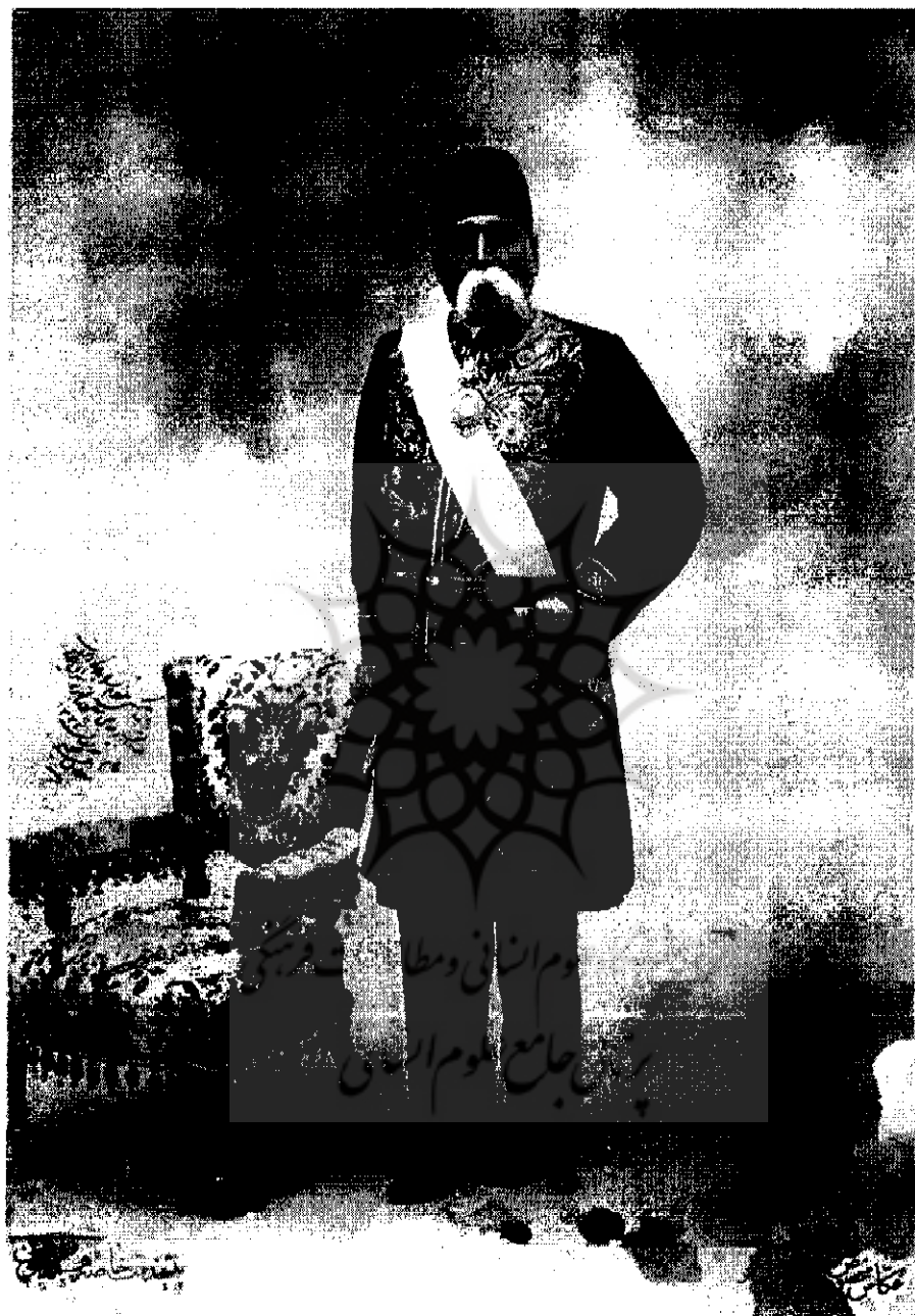
عین الدوله | ۱۳۰۳-۱