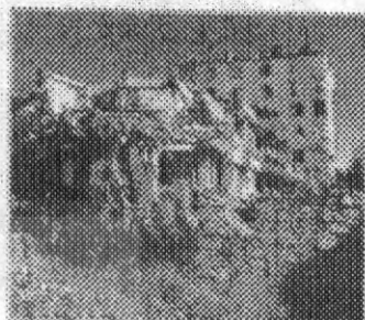
به نظر شما برای پیش گیری از این حوادث چه راه هایی وجود دارد؟