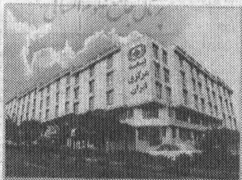
بیمه مرکزی ایران بر فعالیت‌های مؤسسات بیمه نظارت دارد و مقررات لازم در این زمینه را تهیه و تدوین می‌کند.

علاوه بر نمونه فعالیت‌های بیمه که پیش از این ذکر شد، بیمه می‌تواند زیان‌های ناشی از حوادث گوناگون دیگری را نیز جبران کند. شما با کدام یک از دیگر انواع بیمه آشنا هستید؟ چند نمونه ذکر کنید، هر یک از این بیمه‌ها برای انسان چه فایده‌ای دارد؟