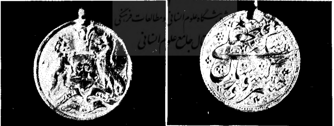
شکل ۳- عکس رو و پشت سکه طلای فتحعلیشاه قاجار است که در موزه ایران باستان به شماره ۳۷۷ ضبط می باشد .

دوم سکه اشرفی بود با هجده نخود طلای خالص که روی آن مصرع زیر ضرب شده بود «سکه فتحعلی شه خسرو کشورستان» و این سکه های طلا را نیز «کشورستانی» نامیدند ولی چون پول طلا کمتر از سکه های نقره در دسترس مردم بود از این رو نام آن مانند نام «قران» شهرتی نیافت و رفته رفته فراموش گردید آقای مشیری که کتابی در زمینه سکه های ایران در دست تألیف دارند باید بهتر از اینجانب بدانند سکه طلایی که در مجموعه سکه های موزه ایران- باستان مشاهده کرده و تصویر آن را در مقاله شان آورده اند ، همان سکه «کشورستانی» فتحعلی شاهمی است که بسال ۱۲۴۱ ه . ق . با آرم مورد بحث ضرب شده است . ( شکل ۳ )