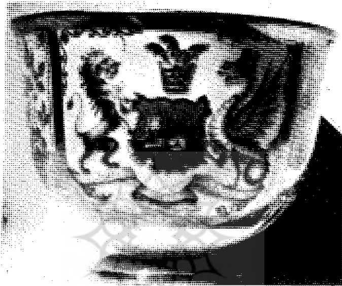
شکل ۲ - پیاله چینی با آرم سلطنتی که از طرف دولت انگلیس به فتحعلی شاه هدیه گردیده است .

عیناً شبیه به آرم سکه مزبور بر روی آن نقش شده و از طرف دولت انگلیس به فتحعلی شاه هدیه شده است و وجود همین ظرف خود به تنهایی ثابت می‌کند که این علامت محض تفنن و یا بیخودانه بر روی آثار مختلف نقش نبسته و منظور از آن نمایاندن آرم سلطنتی ایران بوده است (شکل ۲).