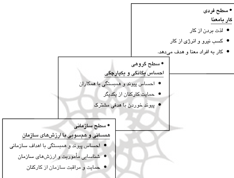
شکل 2- معنویت در محیط کار با توجه به سه سطح فردی، گروهی و سازمان منبع: (Milliman, CzaPlewski & Ferguson, 2003)

مراکز علمی و دانشگاهی، معنویت در بر گیرنده مفهومی از تمامیت، کمال، پیوستگی در محیط کار و ارزشهای عمیق در کار است. بنابراین، معنویت در سازمان در سطح فردی؛ تلاش برای یافتن معنا و هدف در زندگی کاری، در سطح گروهی؛ ارتباط قوی بین همکاران و افرادی که به نحوی در کار مشارکت دارند و در سطح سازمانی؛ هماهنگی بین اعتقادات و باورهای اصلی و ارزشهای سازمان است.